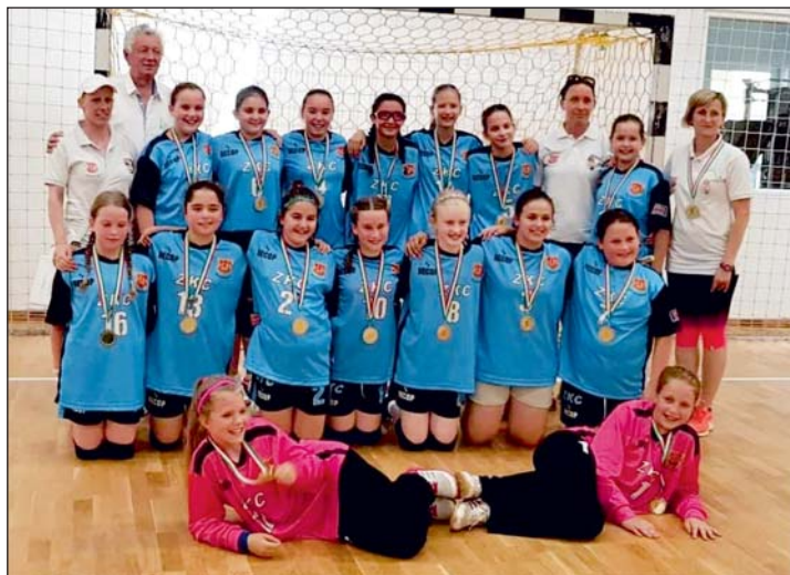
Az aranyérmet szerző U11-es együttes.