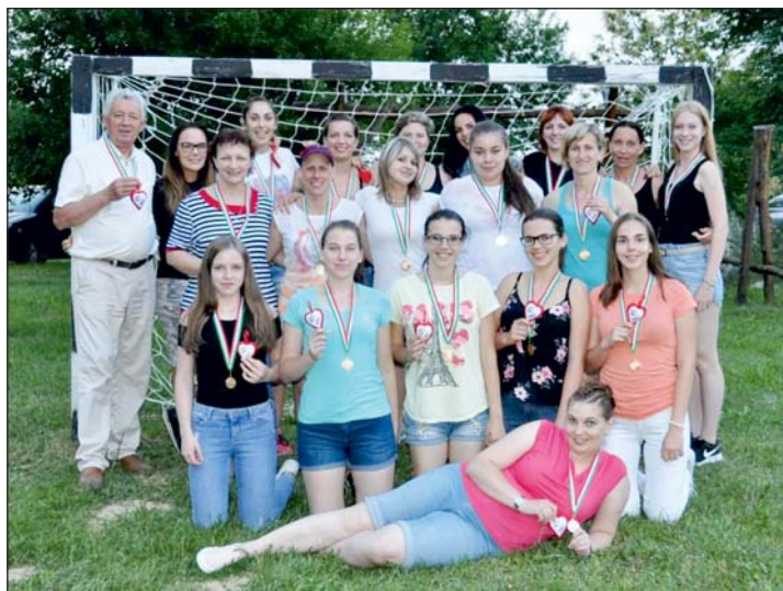
A bronzérmes női csapat.

A mérkőzések mellett sok más program színesítette a kézilabdások életét a közelmúltban. A Papp László Sportarénában a Magyar Kupa elődön-