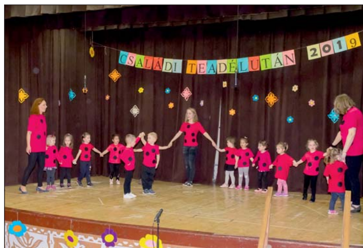
A „katicák” tánca...

Nagyon szépen köszönjük a szülői munkaközösségnek és az óvoda valamennyi dolgozójának a kitartó munkát, valamint a fellépőknek, hogy előadásukkal megörvendeztették a megjelenteket, és persze, nagyon szépen köszönjük valamennyi vendégünknek, hogy eljöttek erre a vidám rendezvényre.