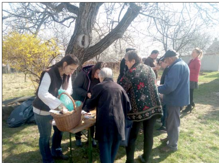
Idén kibővült a rendezvény.

Reméljük, pár éven belül már a gyümölcsöt élvezhetik ennek a szép napnak, illetve hagyománnyá válik a virág- és zöldségmagok cseberéje is.