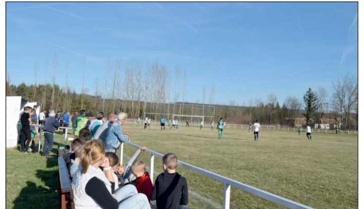
Dobogós helyezés a célkitűzés.

Március 17-én, vasárnap játszotta szezonnyitó mérkőzését a Zalacsány SE. A megyei III. osztály Keleti-csoportjának csapata a Kehidakustány SE játékosaival mérkőzött meg, mely végül a kehidaik győzelmével zárult.