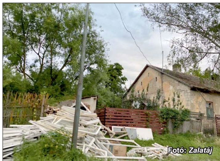
Gyár utcai „életkép”.

ban élöket. S ennek valahogy nem akarnak örülni a már konszolidált, integrált környezetben élő aranyodiak, zalaudvarnokiak, zalakoppányiak. Hogy miért? Ha valaki jól ismeri a zalaszentgróti állapotokat, s megkérdezik, hogy mit tud a Gyár utcai 57-63-as számú ingatlanról, annak lakóiról, azonnal megadja a választ. Nem emlegetnek szegregációt (elkülönítést), akcióterületet, integrációt, hanem magyarul beszélnek. Beilleszkedésre, normális együttélésre alkalmatlan emberekről szólnak a válaszok. Egyébként a zalakoppányi rész egyik legfontosabb közösségét