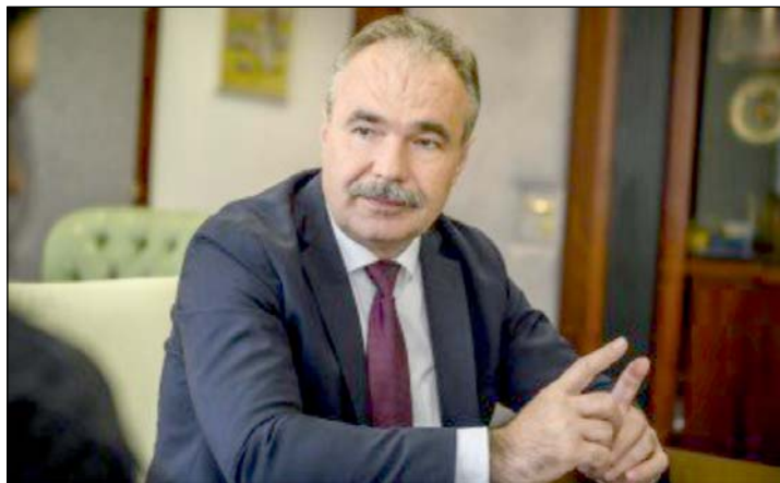
Nagy István agrárminiszter.

A törvény célja, hogy erősödjön a tulajdonosi szemlélet, mert azáltal a föld minősége, termőképessége is javítható, és így a magyar mezőgazdaság is versenyképesebbé válhat – mondta az agrárminiszter. Nagy István beszélt arról is, hogy a sertéshús után a magyar zöldségekre, gyümölcsökre, juh, kecske és marha termékekre is kiterjesztik a megkülönböztető jelzést a tudatos vásárlás erősítése érdekében. (Forrás: MTI )