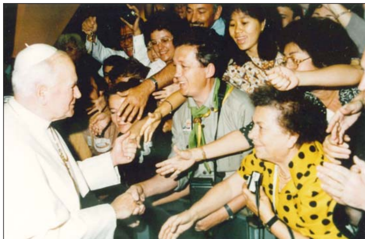
Kézfogás a pápával...