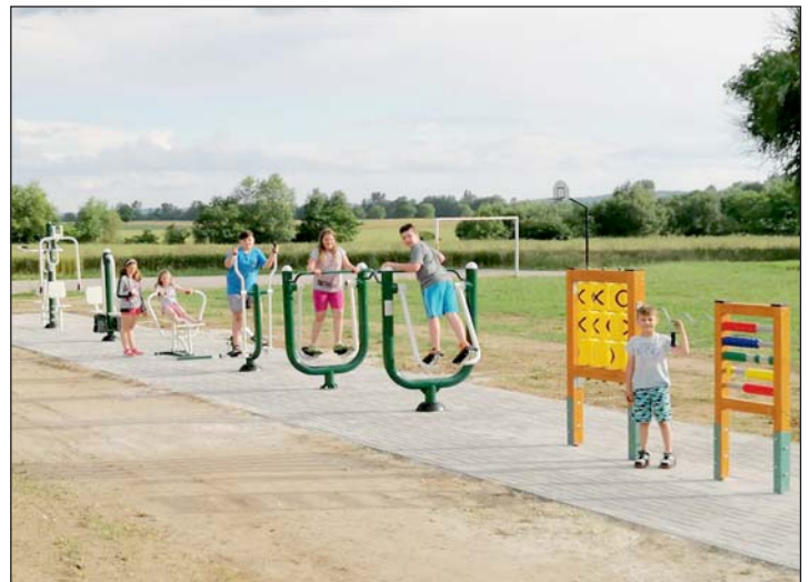
A sporteszközök egy része már a helyére került.

A fiatalok a „próbaüzem” tapasztalatait örömmel osztják meg egymással!