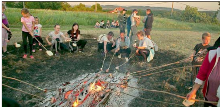
A szalonnasütés sem maradt el.

Mostanra már hagyománnyá nőtte ki magát Türrjén, hogy Szent Iván éjjelén, másnéven a nyárközép éjszakáján túrára indul a falu apraja nagyja. Először kétséges volt a helyzetre való tekintettel, hogy végül meg tudják-e tartani a programot, de a nagy érdeklődés miatt úgy gondolták, hogy egy közös kiruccanás csak erősíti a község összetartó erejét.