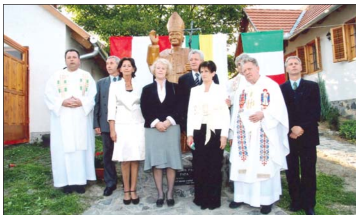
2007 szeptemberében került sor a szobor felavatására és megáldására.

ládi birtokán szobrot állíttatott a pápának. Ennek azonban volt(ak) előzménye(i).