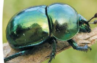
Tavaszi álganéjtűró 2020 bogara