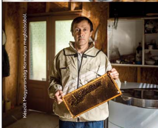
Készült Magyarország Kormányra megbízásából.