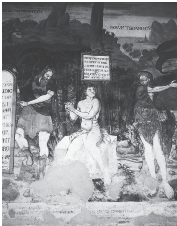
5. kép. Az ember Mózes és a Keresztelő között