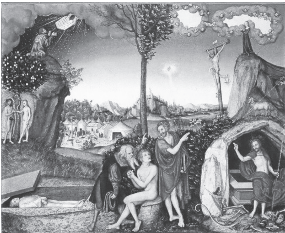
2. kép. Lucas Cranach: A törvény és az evangélium . Prágai Nemzeti Galéria

telő János Krisztushoz irányítja az embert. Feltűnik, hogy a bal, vagyis az ószövetségi oldalon álló próféta is a Megfeszítettre mutat az ujjával.