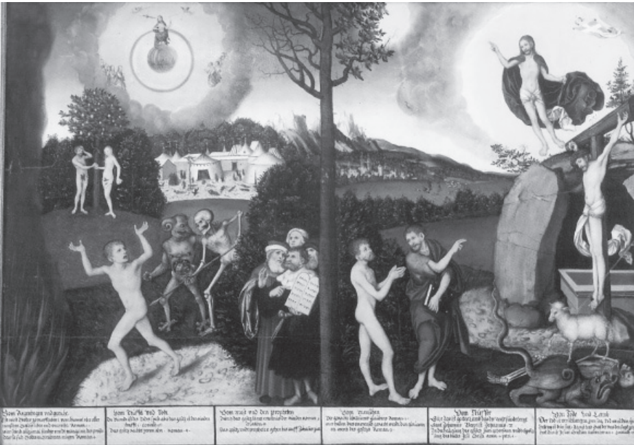
1. kép. Lucas Cranach: Kárhozat és megváltás . Stiftung Schloss Friedenstein, Gotha

az ember kétszer szerepel – a kép bal és jobb oldalán egyaránt látható; ezzel szemben a prágai típuson (2. kép) csak egyszer lehet látni az embert – a kép közepén, a fa alatt.