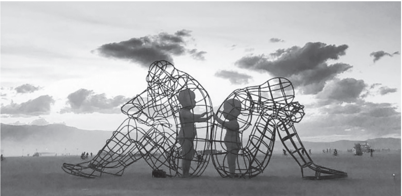
Alexander Milov: Szerelem . Konfliktushelyzetben felnőttként gyakran elfordulunk egymástól, eltávolodunk, hogy „védjük” magunkat, de benső, gyermeki énünk ilyenkor is kapcsolódni szeretne.

lönbötötték meg, a szorongó-ellenállót és a szorongó-elkerülőt. Mindkét esetben az a jellemző, hogy a gyermek tart attól, hogy a szükségletei nem lesznek kielégítve. Az anya távozásakor ezek a gyermekek bánatosak, de a visszatéréskor nem fogadják örömmel. Az elkerülők nem keresik és nem is fogadják szívesen a kontaktust, míg az ellenállók dühvel fogadják a közeledést. Később kibővítették a csoportokat a dezorganizált kötődési móddal, amely leginkább a traumát átélt szülők gyermekeire lehet jellemző. Úgy találták, hogy ezek a kötődési mintázatok megmaradnak az élet során, és a későbbi fontos személyekhez való kötődést is jellemezni fogják. Susan Johnson a biztonságos kötődési szükségletet egy egész életen át tartó legfőbb érzelmi szükségletnek tekinti, amely a boldogságunk nélkülözhetetlen alapja. Erre a megközelítésre alapozta Les Greenberggel az érzelem fókuszú terápia módszerét, amelyről hamar bebizonyosodott, hogy az egyik leghatékonyabb terápiás módszer.