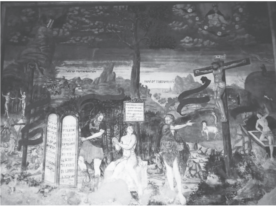
3. kép. Wenzel Aichler: A törvény és az evangélium . Ranten bei Murau, Steiermark

kereszt szemközti párjaként lett világosan s ennek megfelelően azonos méretben megrajzolva.