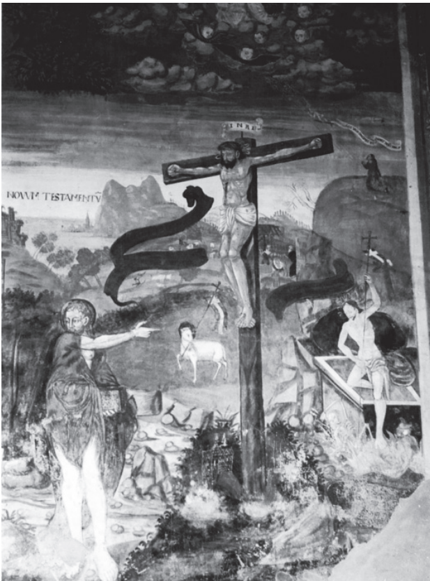
4. kép. A ranteni freskó jobb oldala

A 4. kép jobb oldali részének felső pereme erősen felhős mennyei zónát mutat, benne az Atyaistennel mint a világ Urával. Mária imádkozva térdel Sion hegyén. Alat-