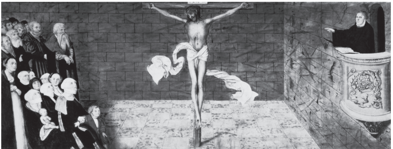
4. kép. Id. Lucas Cranach: Wittenbergi oltárkép , 1547

Péterére tekintve megállapíthatjuk, hogy Jézus tanítványának rettentő hosszú utat kellett megtennie, amíg eljutott a kereszttel való vállalásáig. Ő volt az a tanítvány, aki látványosan tiltakozott, amikor Jézus megmondta: az Emberfiának szenvednie kell. Péternek leginkább az tetszett, amit a megdicsőülés hegyén élt át: amikor Jézus arca fényelt, mint a nap, ruhája is fehéren ragyogott. „ Jó nekünk itt lenni ”, mondta akkor Péter. Ám aztán – Luther szavával – a dicsőség teológiájától eljutott a kereszttel való vállalásáig.