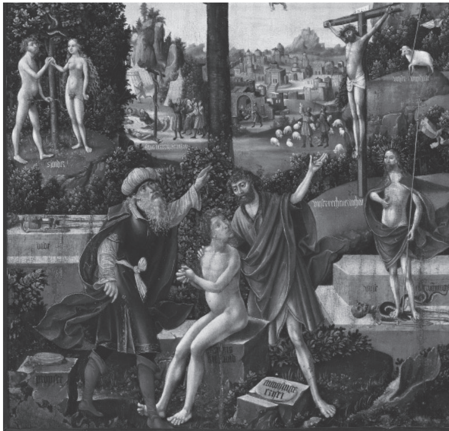
2. kép. Hans Kemmer: Törvény és kegyelem , 1540

igéjét semmi nem helyettesíti. Joggal mondja Reményik Sándor az Igéről, hogy az csak az az Élet kenyere, „Ki Evangélium és semmi más, / Nem tudás, művészet, magyarkodás...”