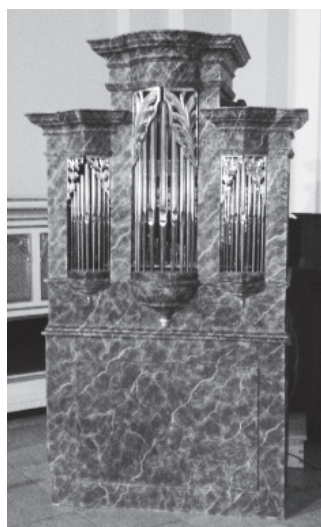
A torvaji orgona a Deák téren.