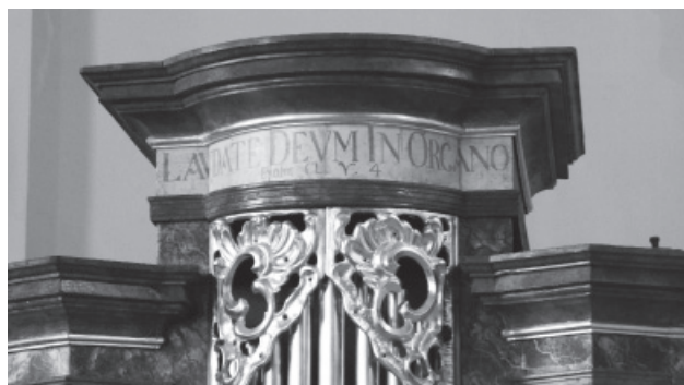
Felirat a nagyvázsonyi templom restaurált orgonáján.

2013-ban új fejezet is kezdődött a Deák téri orgonás életben, amikor először a torvaji, majd a nagyvázsonyi templom művészi igényességgel restaurált kis hangszere került ideiglenes használatra a templomba. 40 Mindkét pedál nélküli pozitív rövid oktáv hangterjedelmű, hangolásuk középhangos. A restaurálásukat az AeriOrgona Kft végezte. Szakmai körökben és érdeklődők között is nagy figyelmet keltettek és egyértelmű elismerést arattak ezek az orgonák.