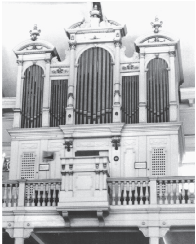
Az 1901-ben felszentelt Angster orgona