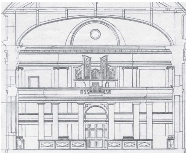
Heroteck orgonája Benkó 1867-es metszetén.

Heroteck 1781 körül Morvaországból települt át Pestre. Gazdag díszítésű, mozgalmas vonalú orgonaházak jellemzik hangszereit. 7 Hangjukra egyaránt jellemző a telt