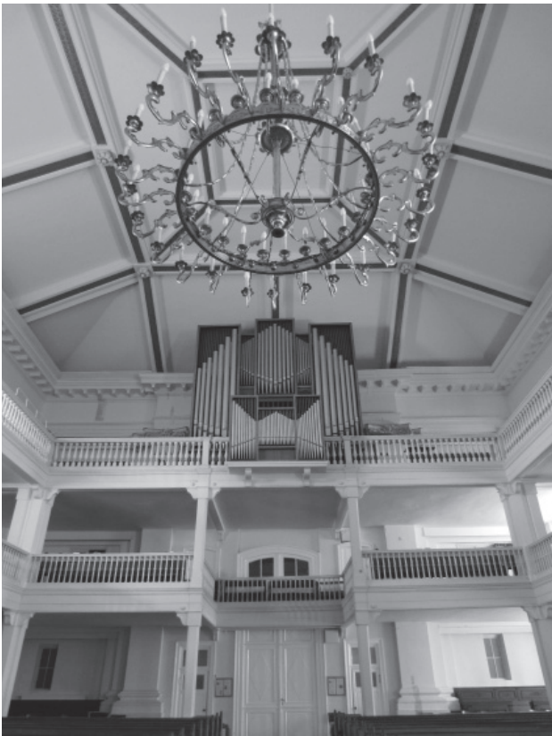
A Deák téri templom 1971-ben felszentelt mai orgonája.

A negyvennégy regiszteres, hárommanuális, pedálos hangszer az északnémet barokk orgonák stílusát idézi az orgonareform szellemében. A tömör hangzású főmű az orgonatest középvezetékében, felül helyezkedik el, ezt ellenpontozza a jellegzetes barokk szólóhangszíneket felvonultató Rückpositiv. A Brustwerk közvetlenül a játszóasztal fölött található csillogó, játékos regisztereivel. A pedál legnagyobb sípsorai kétoldalt állnak. Feltűnően gazdag diszpozíciója szintén északnémet barokk mintákat tükröz. 31 A Deák téri orgona csaknem száz év után az első nagy hangszer, amely csúszkaláda rendszerű szelládarendszerrel, mechanikus traktúrával épült hazánkban. Ezekkel és az alacsony szélnyomással, illetve az intonációval a neobarokk elveket követték a kor legjobb tudása szerint. Mindez óriási kihívást jelentett szakmai szempontból, hiszen az orgonaépítőknek több évtizede feledésbe merült technikákat kellett megtanulniuk. Tervező és kivitelezők a lehető legmagasabb szakmai színvonalon végezték dolgukat, sokszor szinte teljesíthetetlen feladatokat oldottak meg lehetetlent nem ismerő ügyszeretettel, elszánással és kreativitással. A politikai légkör is nehezítő tényező volt, hiszen importra alig volt lehetőség. A szelládákat, a nyelvregisztereket és a motort németországi cég készítette svédországi adományokból.