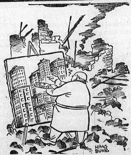
Churchill: Az összebombázott London helyébe megfestem a világ legszebb városát.

A palesztinai hatóságok elrendelték a 20—30 éves zsidó fiatal emberek zászlók alá hívását. A zsidókat Irák ellen dobják harcba. Hír szerint máris több ezer zsidó katona harcol Irákban.