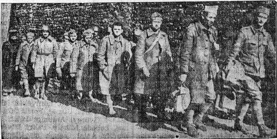
Hadifoglyokat kísérik a németek

Meszes tojás helyett olajos tojás. A tojás konzerválása mindenkori nagy gondot okozott az embernek. Mivel a tyukok nem tojnak egész éven át egyenletesen, az lenne fontos, ha a friss tojást el tudnánk tenni megbízhatóan hosszabb időre is. A tojás tulajdonképpen azért romlik meg, mert meszes héjának igen apró likacsain át behatolnak a belsejébe a levegő rothasztó baktériumai. A konzerválásnak tehát az a célja, hogy ezt megakadályozza. Eddig ugyszólván egyetlen mód volt erre, az, hogy bemeszelték a friss tojásokat kívülről s a méz eldugaszolta a héj likacsait. Viszont mindenki tudja, hogy a meszes tojás idővel mégis meglehetősen kellemetlen ízt kap és nem is jó például lágy tojásnak. Mint Amerikából jelentik, most aztán megtalálták mégis a tojás konzerválásának biztos módját. A friss tojást mindenekelőtt légritkitott térbe teszik, amikor a benne lévő parányi levegő is kijön. Az így kiszivattyuzott tojást aztán egy szagtalan és iztelen olajba mártják bele, amely tökéletesen eldugaszolja a héj likacsait s egyáltalán nincs ártalmára a tojás ízletességének.