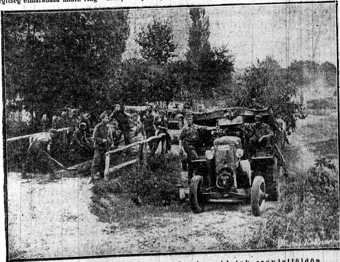
Utatlan utakon nyomulnak előre honvédeink szovjetföldön

Németország figyelme éberem őröködik a közelkeleten és nem kell meglepetésektől tartani.