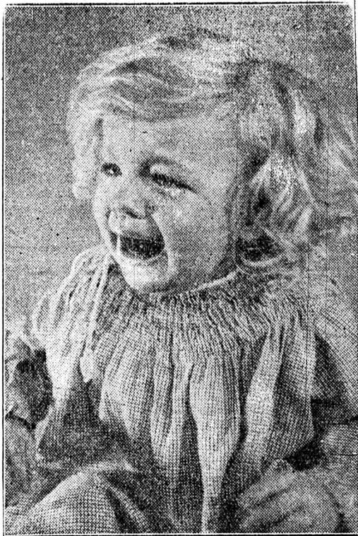
Egy kislány, aki sir

szeretett. Egy szó nélkül reggelizett és az ajtóban várta, hogy a mamája is elinduljon. És amikor elindult, akkor történt az első csoda.