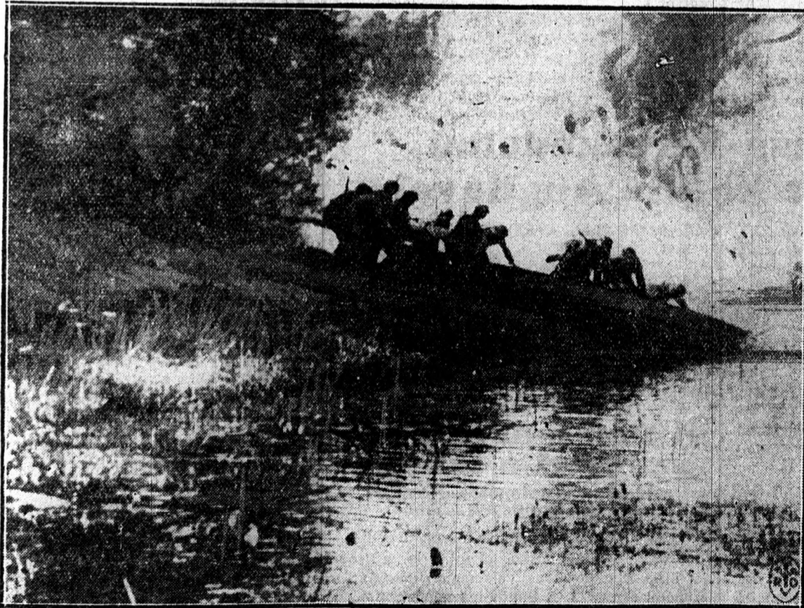
MNN ROHAMCSÓNÁK TÁMADÁSRA INDUL A SZOVJETFOLD EGYIK TAVÁN

Szebb lesz mint volt, olyan lesz, amilyennek minden magyar elképzeli, nagy és hatalmas. De nekünk kell nagygyá és hatalmassá tenni. Nekünk kell ősz szefogni egy emberként s dolgozni a jövő érdekében. Merítsünk erőt az ő gondolataiból és lelkesedést, áldozatkésztséget a rávaló emlékezésből.