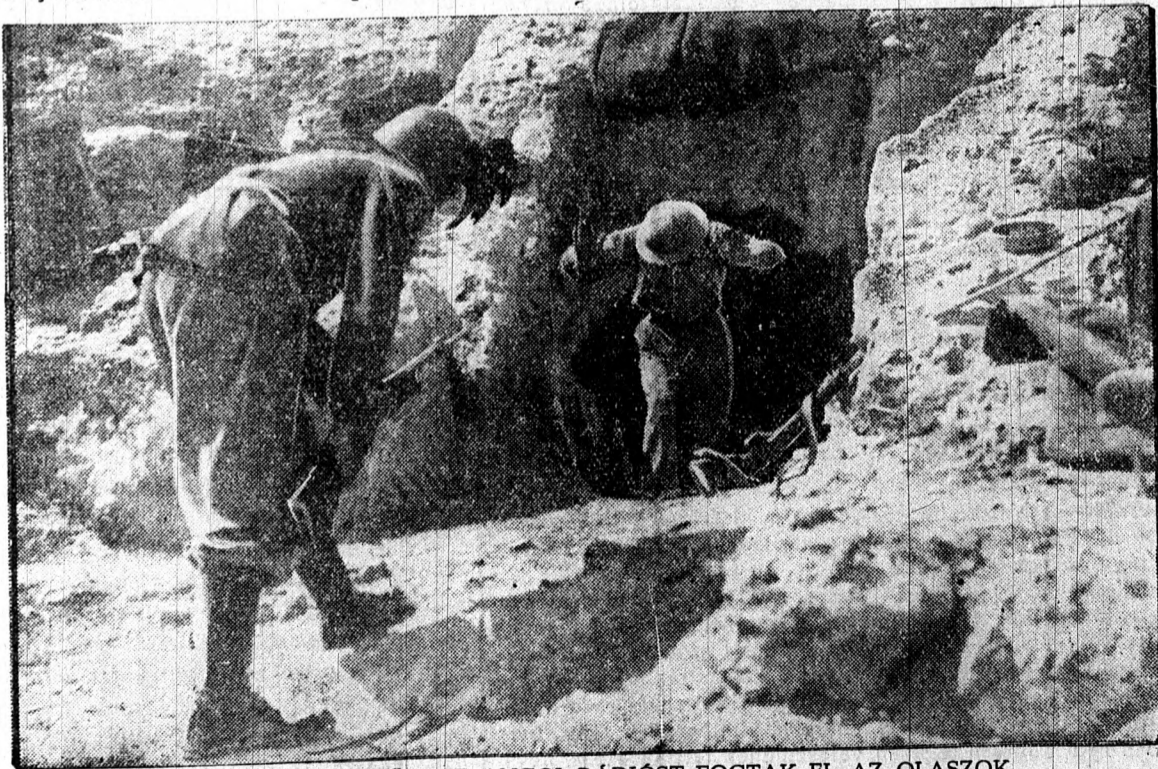
KAVERNÁBA REJTŐZOTT ANGOL RÁDIÓST FOGTAK EL AZ OLASZOK

konferenciának a Szovjet szempontjából nem jósl jelentős eredményt az olasz sajtó. A Messagero úgy látja, hogy a Szovjet ismét keserűen csalódik. Angliának sohasem volt komoly szándéka a Szovjet jelentős katonai megsegítése és mesterkedéseinek csak az a célja, hogy a Szovjet bízva az angolszász segítségben minél hosszabb ideig folytassa az ellenállást, ami Anglia malmára hajtja a vizet.