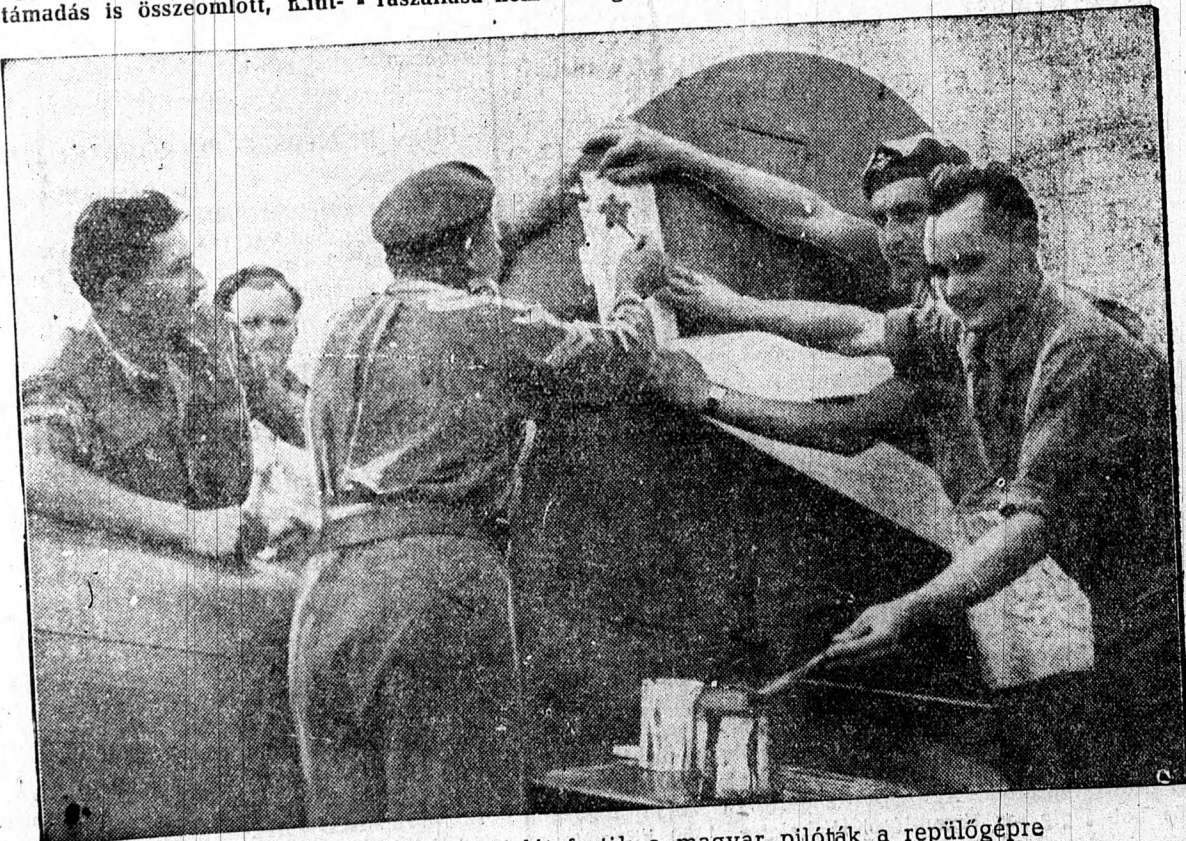
A legújabb légyőzelem jelét festik a magyar pilóták a repülőgépre

Égjen és hirdesse, hogy van és lesz feltámadás, hogy minden sötétségnek eljön egyszer a hajnala.