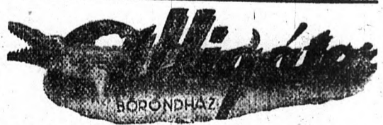
Zombor, Pótfői utca 8 szám. Női fáska, büröndök, pénztárcák, akta és iskolatáskák legolcsóbbtól a legfinomabbig

Az apatini autóbusz is beszüntette a járatot. A hóvihar behordta az utakat, kocsin is alig lehet kimozdulni a határba. A szél ereje még szombaton este sem csökkent.