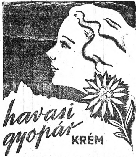
SZEPLŐ, PATTANÁS ELLEN — KITÜNŐ ARCÁPOLÓ ZSIROS BŐRRE: KÁMFOROS HAVASI GYOPÁR-KRÉM

Európának egyenesen szüksége van er- re a feszültségre, hogy egységes legyen és hogy új alakját kiformalhassa. Mert feltéve — folytatja Winschuh, —