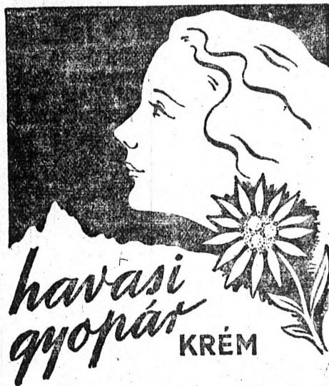
SZEPLŐ, PATTANÁS ELLEN — KITÜNŐ ARCÁPOLÓ ZSIROS BŐRRE: KÁMFOROS HAVASI GYOPÁR-KRÉM