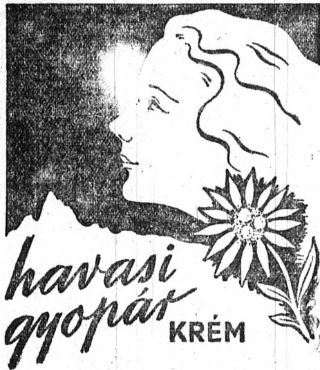
SZEPLŐ, PATTANÁS ELLEN — KITŰNŐ ARCÁPOLÓ ZSIROS BŐRRE: KÁMFOROS HAVASI GYOPÁR-KRÉM

Az előadó rámutatott arra, hogy az Országos Központi Hitelszövetkezet szervezete alapján eltér a volt jugoszláv rendszertől. A magyar hitelszövetkezetek teljesen önkormányzati alapon állanak, de együttműködésük a közérdeknek felel meg. A csonkamagyarországi hitelszövetke-