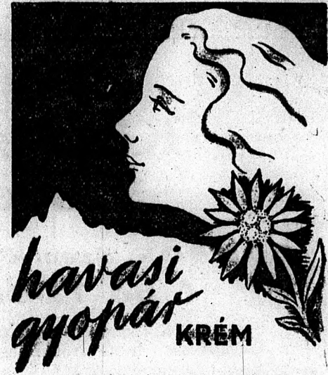
SZERLŐ, FATTANÁS ELLEN - KITŰNŐ ARCÁPOLÓ ZSIROS BŐRRE: KAMFOROS HAVASI GYOPÁR-KRÉM