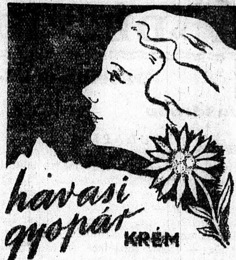
SZÉPLEGÉNYEK ELLEN — KÜTÜNŐ ARCÁRÓLÓ ZÉRÓS BŐRREK KÁMFOROS HAVASI GYOPÁR-KRÉM

Azt szereti, ha tényekkel, nem pedig átláthatatlan legendákkal áll hallgatóságának tömegei elé, mint ahogyan azt bizonyos washingtoni magasállású urak oly gyakran és szívesen teszik. Ha nem dolgozik, ideje legnagyobb részét fia-