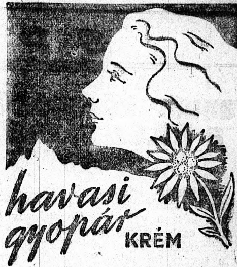
SZEPLŐ, PATTANÁS ELLEN — KITŰNŐ ARCÁPOLÓ ZSIROS BŐRRE: KÁMFOROS HAVASI GYOPÁR-KRÉM

A zombori utcán megfagyott egy csurogi földműves. A rendőrszolgálat szombatra virradóra a város szélén holtan találta Topolszki Rádó 40 éves csurogi illetőségű