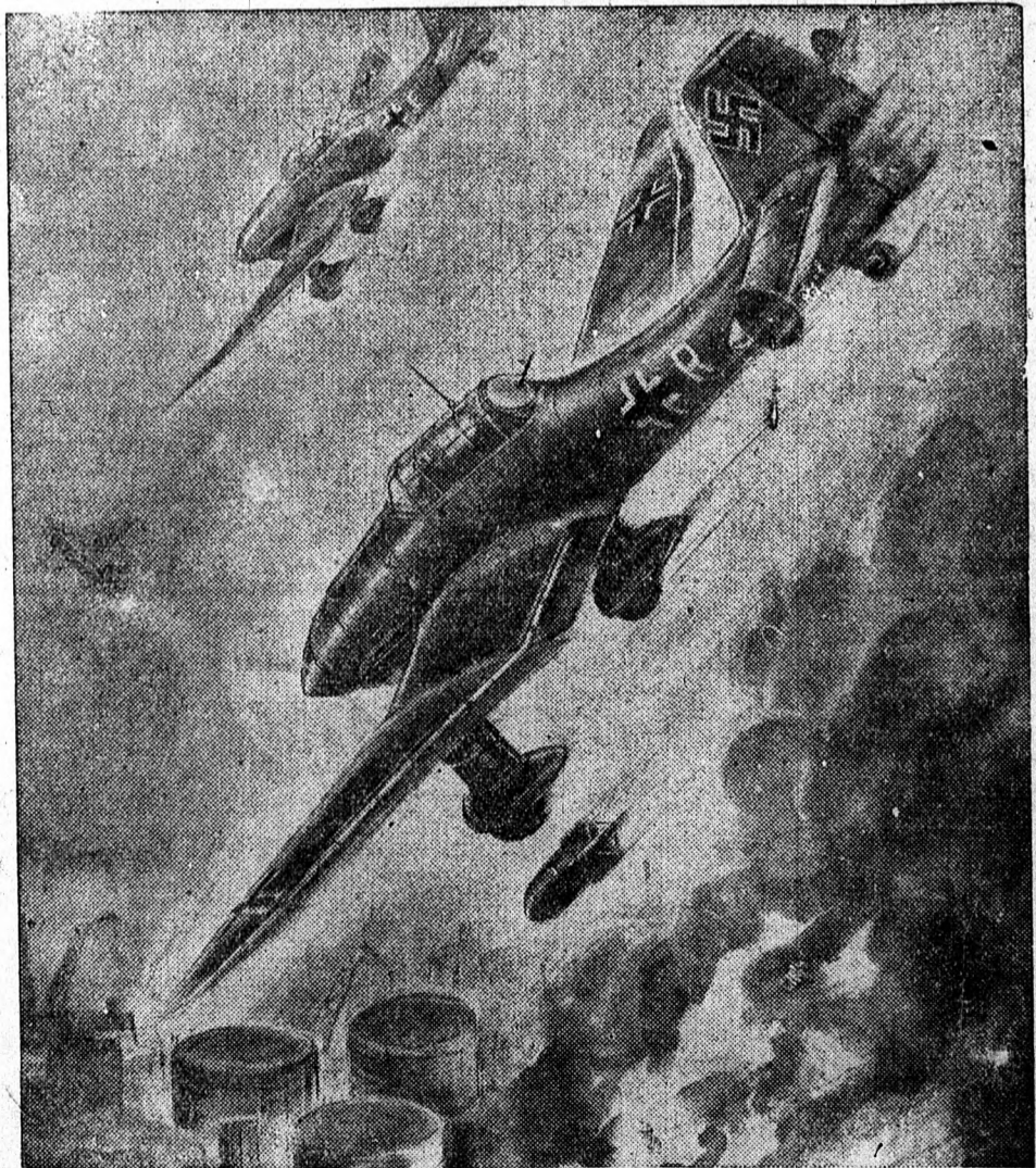
NÉMET STUKÁK TÁMADÁSA