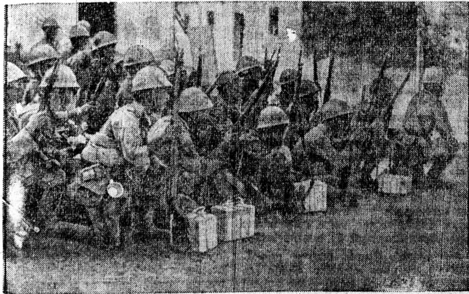
JAPÁN CSAPATOK ROHAM ELŐTT

Ezen a gyönyörű szigeten minden a petróleum körül forog. Tulajdonképpen a mostani háború is ezért a kincsért folyik, mert Amerika és Anglia el akarta zárni Japánt az olajtól, hogy így megbénítsa és ezt a távolkeleti szigetország nem tűrhette. Paradicsomi élet volna ezen a szigeten, ha nem leselkednék állandóan a szegény lakosságra az alattomos halál: a malária veszedelem. Esténként millióld moszkítószúnyog száll fel a mocsarokból és a malária betegséget terjeszti és ezt a betegséget elsősorban az ott élő fehérek kapják meg.