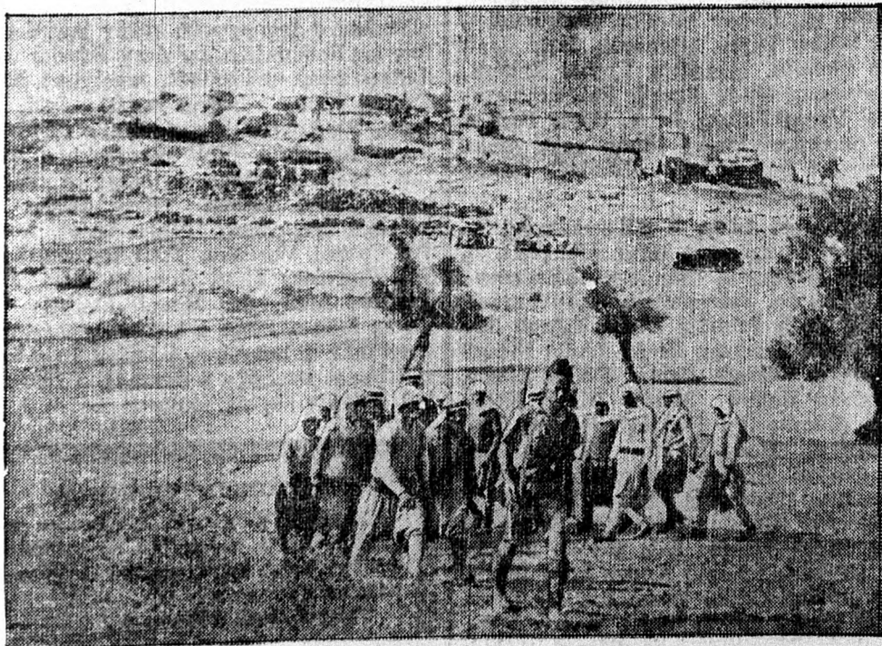
FOGLYOK A SIVATAGBAN

A házassági postának máris nagy sikere van. Kiadóhivatalunkba tömegesen érkeznek be a levelek. Nemcsak érdeklődők írnak, hanem hirdetéseket is küldenek. Az első hirdetéseket vasárnapi számunkban közzöljük.