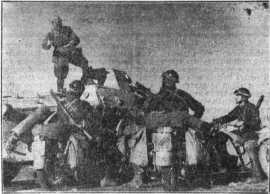
Egy felderítésre induló olasz páncélos osztag megkapja a parancsot

A Szövetkezeti Asszonyliga topolyai csoportja szeretetsomagokat küld a frontra. A Szövetkezeti Asszonyliga ülést tartott, amelyen elhatározták, hogy szeretetsomagokat küldenek a frontra. A korszerű ételek propagálása érdekében főzőtanfolyamot rendeznek.