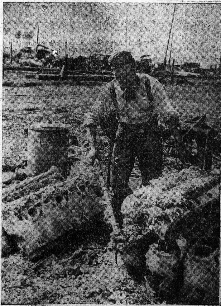
A sztalingrádi uccai harcok után

A véderő főparancsnoksága közli, hogy a 223. német hadosztály szakaszán megsebesült német katonák sebesüléseit dum-dum golyó okozta. A később zsákmányul ejtett szovjet lőszer között talált dum-dum golyós ládák egy angol gyár jelzését viselték.