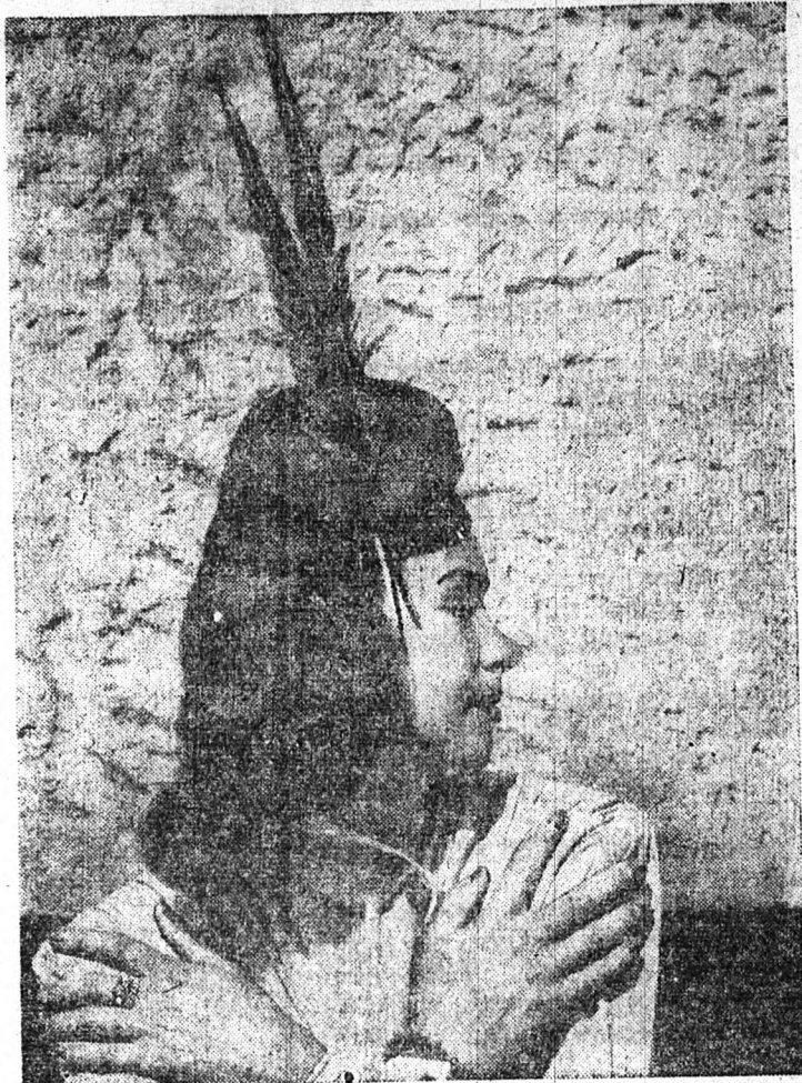
Csinos illecből, vagy velourból készült kalap. Egyszerű fez forma, amelyet egyetlen — tollakkal letűzött — redő díszít. A két fécántoll igen fiatalosan hat.

A boldog férfiak szigete. Az Ausztrália és Új-Guinea közti Torres-szorosban fekszik egy kis sziget. Badu. Tulaidonképpen az Egyesült Államok fenhatósága alá tartozik, de önkormányzata van, még pedig nagyon különös. Ott fehér ember és 250 benszülött lakik a szigeten s a kormányzó tisztet egy asszony tölti be, a félérek közül. Három benszülött tanácsadója van, s ezeken kívül még három főből álló rendőrsége. Tévedés volna azt hinni, hogy a férfiaknak rossz dolguk lehet a szigeten. Ellenkezőleg, sehol a világon nincs olyan jó dolguk, mert az asszony evike lehet azoknak a keveseknek, akik nagyon jól ismerik nemük hibáit. A kormányzó nő ugyanis minden eszközt megragad, hogy a férfiak nyugodtan és boldogan élhessenek és dolgozhassanak s a leghigorubb büntet minden asszonyt, aki veszekedéssel, oktalán féltékenykedéssel és más női rossz szokásával, például parancsolgatással keseríti meg férje életét. A nők természetesen lassanként megértették a dolgot és alkalmazkodtak a bölcs asszony rendszéréhez, úgyhogy a szigeten nincs házastársi perpatvar, nincs boldogtalan férfi vagy feleség.