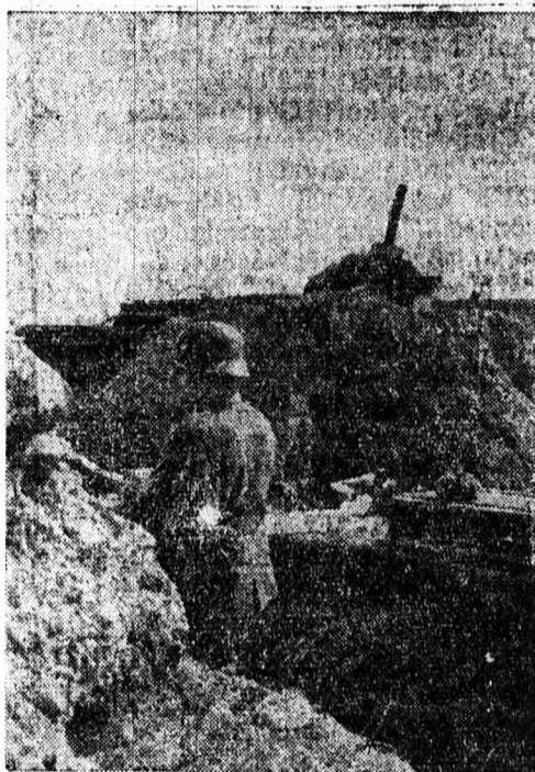
Széllelt szovjet páncélos a német állások előtt.