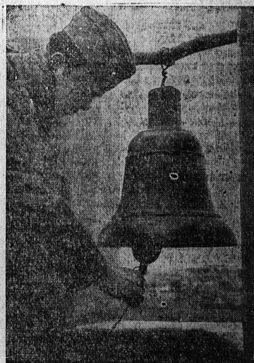
RIADÓ AZ ARCVONAL MÖGÖTT

Az innen keletre fekvő kikötők a rivierai vendégforgalom lebonyolítását szolgálják; Fréjus, St. Raphael, végül pedig Nizza, az Olaszország felé vezető út kapujában. Kikötőberendezései majdnem egészen újak, s köztük a kék vizen legújabbnyire idegenek yachttjai ringanak. Szomszédságában fekszik Villefrance, amelyet 1295-ben alapított Anjou Károly, Szicília királya; ez szintén hadikikötő. (TEK)