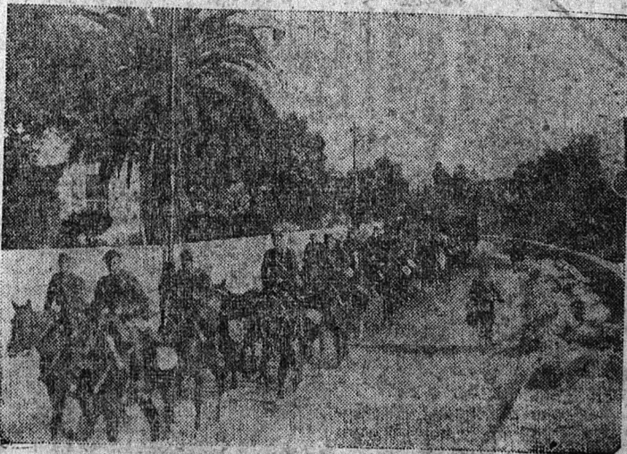
Német lovasság a francia Rivierán

Az afrikai helyzet hullámai Londonban kormányátalakításra vezetnek. Churchill hir szerint két új minisztériumot szervez, az egyik ezek közül az északafrikai francia ügyek minisztériuma lenne.