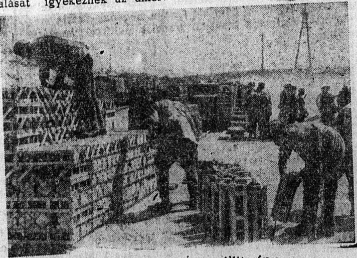
Megérkezett a lőszerszállítmány

Végül utal a lap Benes hozzászólására és Pranzovszky Iván meghatalmazott miniszter Benesnek adott válaszára. Benes a régi versáillesi rendszer visszaállításán ábrándozik, ebben azonban az angolok sem értenek vele egyet. Cripps kijelentette, hogy a háború után észszerű és tartós békét kell létrehozni, nem pedig olyat, amely a bosszúvágyat elégit ki. Ez a kijelentés kétségtelenül Benesnek adott válasznak tekinthető – írja az olasz lap.