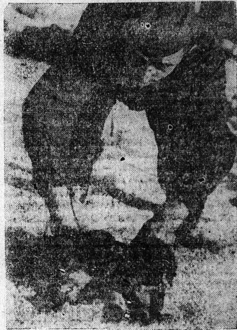
Játszó társai is vannak a német katonának