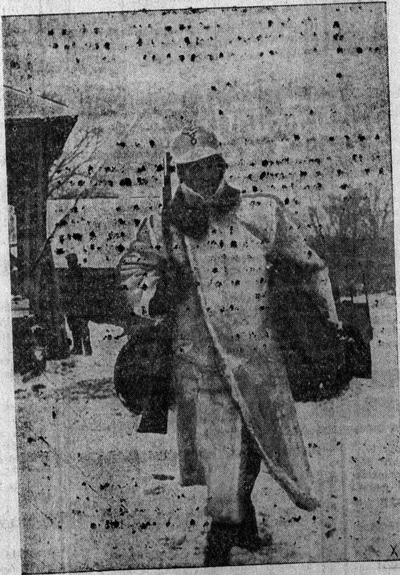
A RUTÁR MEGÉRKEZIK A FONTOS IRATOKKAL

Törökország körül ismét lézsa hírek terjengnek. Állítólag fontos diplomáciai tanácskozások folynak a tengerszorosok országában. A Transkontinent Press berni jelentése valószínűnek tartja, hogy a megbeszélések a szovjet-török viszonyt függenek össze. Moszkva állítólag a tengerszorosok kérdésében olyan megoldásra gondol, hogy körbes bírja ezeket a törökökkel. A TP a következőket írja: A tengerparton, ha ezeket a tárgyalásokat egy olyan egyenmény előkészítésével hozzuk összefüggésbe, amelynek segítségével a Szovjet-tengerpartok fogságának alábbhagyhat.