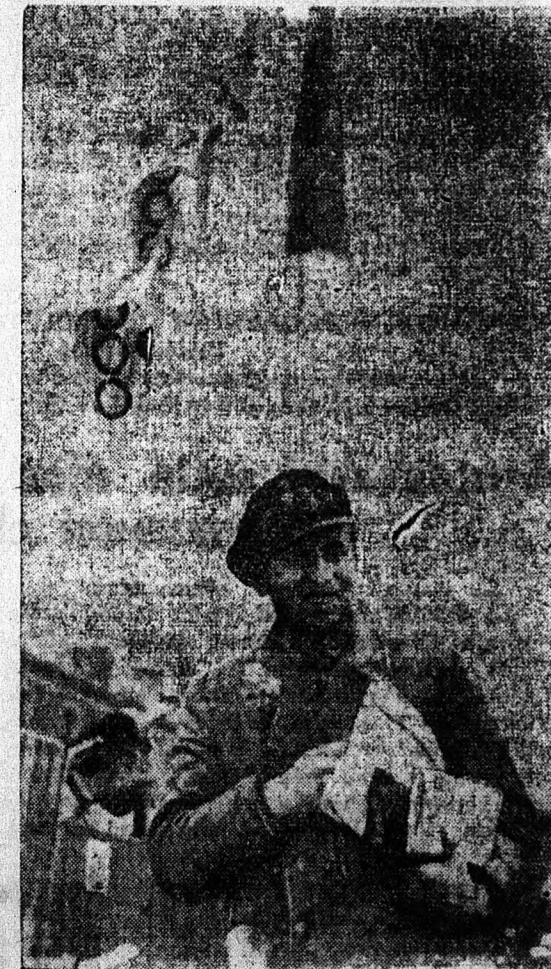
Hosszu portyázás után partra lép egy tengeraltató parancsnok

(MN) Az olasz kormány nagy erőfeszítéseket tesz nagynövésű teknősbékákak a Földközitengerben való meghonosítása érdekében, hogy ezzel az olasz teknőspáncélfeldolgozóipart megmenthesse. A megfelelő »tenyészállatokat» a tengerentúlról még a háboru előtt idejében beszerezte. A teknősbékák a Földközi-tenger sós vizét már meglehetősen megszokták, de még mindig nehézséget okoz, hogy szívesen vonulnak fel az édesvízi folyókba, ahol páncéljuk minősége megromlik.