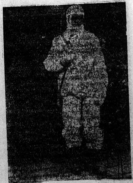
Figyél az eskűs

Madridból jelentik: Jaen spanyol városkában borzalmas rémfürdőt rendezett egy hirtelen esztelen spanyol gazda. A gazdálkodó reggel korán felkelt, magához vett egy balát lemészárolta a feleségét és négy gyermekét, míg az ötödik gyermeket megsebesítette, majd a háziállatoknak esett és kiirtotta egész állatállományát. Borzalmas vérengzését házának felgyújtásával fejezte be, majd, mint aki jól végezte dolgát, kiment a mezőre, ahol a csendőrség elfogta. Megállapították, hogy a gazdálkodón hirtelen kitört az elméje.