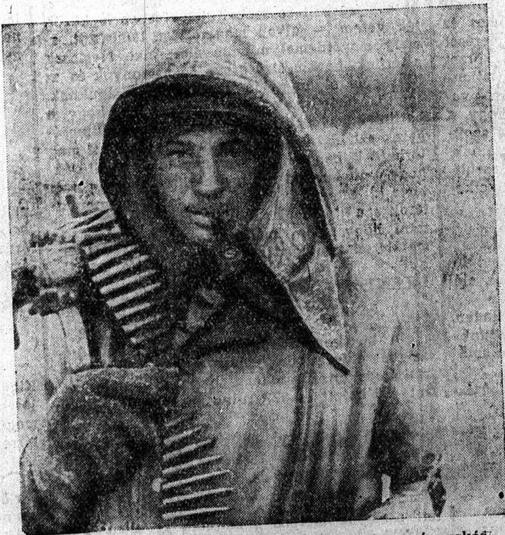
Pipával a szájában vonul előre egy géppuskás

A japán császári főhadiszállás jelentése szerint a japán légi és tengeri erő a Salamon szigetek és Új Guinea közötti harcokban február 16-a és március 5-e között 113 ellenséges repülőgépet semmisített meg. Ezenkívül elsüllyesztettek négy ellenséges tengeralattjárót. A japán veszteség két torpedóromboló és öt szállítóhajó. Ezenkívül elveszett három repülőgép, amely bombarakománnyal együtt a célra vetette magát.