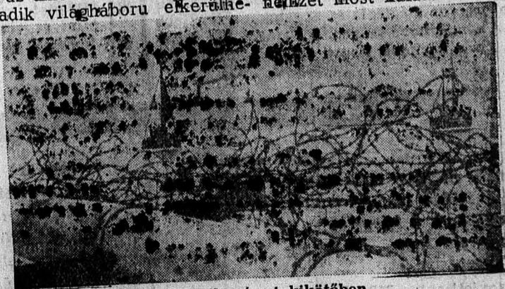
Tél az egyik német kikötőben

sajtó válasza az az angol-szász és semleges oldalról elhang-zott „banácsokra”, amelyek Finn-országot olyan irányban akarják befolyásolni, hogy kössön külön-béket a Szovjetunióval és ennek érde-keiben hozzon területi áldozatot, mondjon le Karjaláról, Hankóról és Petsamoról. A Karjala c. lap azt írja, hogy azok, akik olyan ta-nácsokat adnak, nem értik, mit je-lent a finna népnek Karjala, Petsa-mo és Hanko, ők csak azt látják, hogy ezek kis pontok a térképen, pedig elvesztik a finn népre a ha-lált jelentené. Más finn lapok fog-lalkozva ezekkel a sajtóhan-gokkal leszögezik, hogy hiábava-ló a kísérlet, a belátható-lás nem a finn nemzet, hanem a finn kormány dolga. Jó volna, ha a tanácsadók megismernék a finn történelmet, hogy rájöjjenek arra, miszerint a finn nép számára csak egyetlen út van a jövő biztosítása felé és ez az az út, amelyen a finn nemzet most halad.