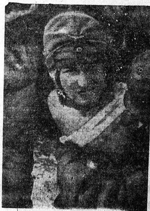
Német ápolónő a fronton