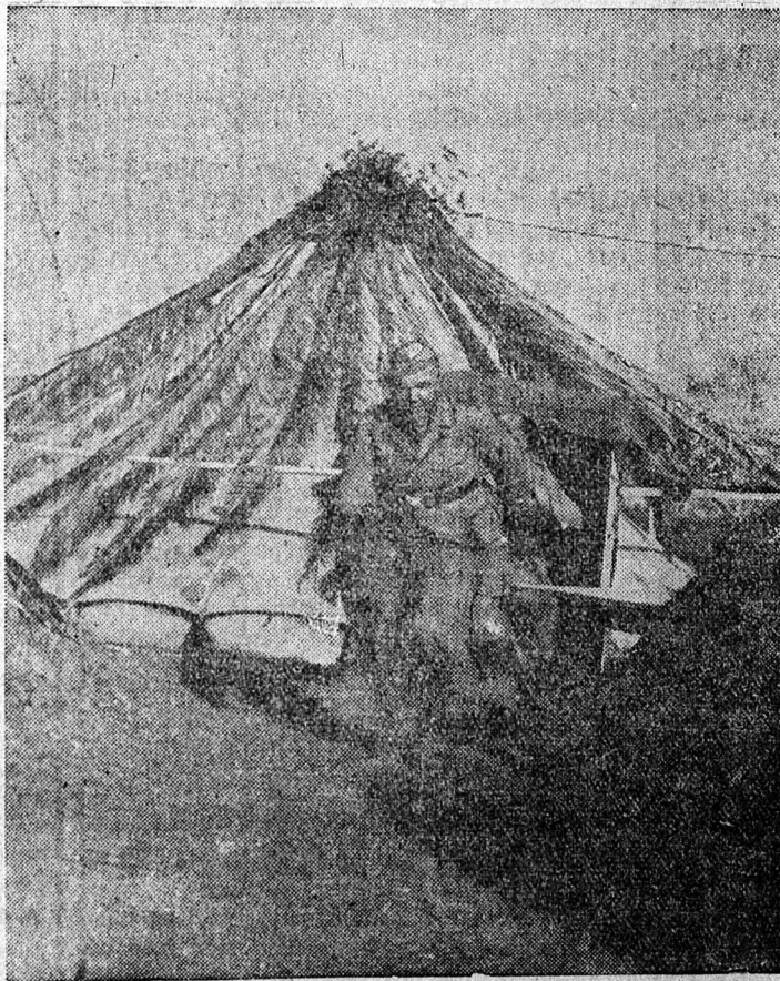
Német állások a szovjet fronton

hindu nacionalista vezér rádió-beszédet intézett a hindukhoz. Felszólította a hindukat, hogy tegyenek meg mindent szabadságuk érdekében, mert India függetlensége már elérhető közelségbe jutott. Nagyázsia ujjáalakulása folyamatban van és Ázsia a jövőben maga fogja intézni saját sorsát. A hinduknak India felszabadítása érdekében külső segítségre van szükségük és ezt a segítséget Japán megígérte. A hinduknak meg kell ragadni az alkalmat és Japánnal együtt folytatni a harcot az angolszászok kiűzéséig az ázsiai földről.