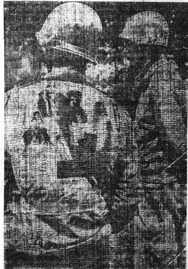
Ilyen „álcázó” festést hordanak egyenruhájukon az amerikai katonák

nyek tehát állandóan épülnek itt a lagunákban s legpompásabb kifejlődésüket Venecia tündéri palotaszorában érik el. Kikötő kikötő volt Venecia kikötője mindaddig, amíg csak kicsiny és nem mélyen járó hajók közlekedtek. De a hajók megnöttek, a laguna víze meg sekélyebb lett s az utolsó 200 évben Venecia csendesen meghalt a világkereskedelem számára, pedig hajdan ő volt az egész Földközi-tenger legnagyobb és leggazdagabb hatalmassága. Nem pusztította el semmiféle ellenség, csak csendesen elhunyt s megmaradt, mint valószínű múzeum, mint Földünk egyik legszebb, legérdekesebb látványossága.