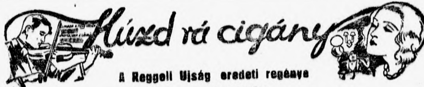
A Reggeli Újság eredeti regénye

— Nem, tiltakozott György. — Nekem nincs semmiféle mentsé- gem... Az ok, a hiba, a bűn: én magam voltam!... Elvertem mind- ent, amit szüleimtől örököl- tem... És most itt állok, ép olyan szegényen, mint maguk, a kató- sztrófa után... De engedjek meg,