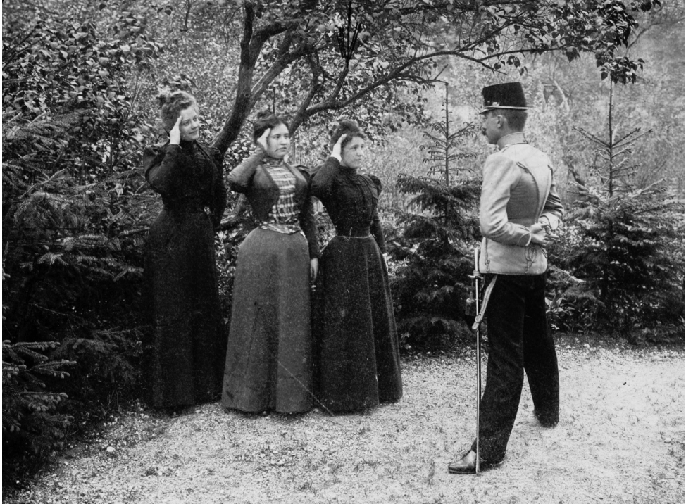
Asszonyok kiképzése, Csejte, 1900