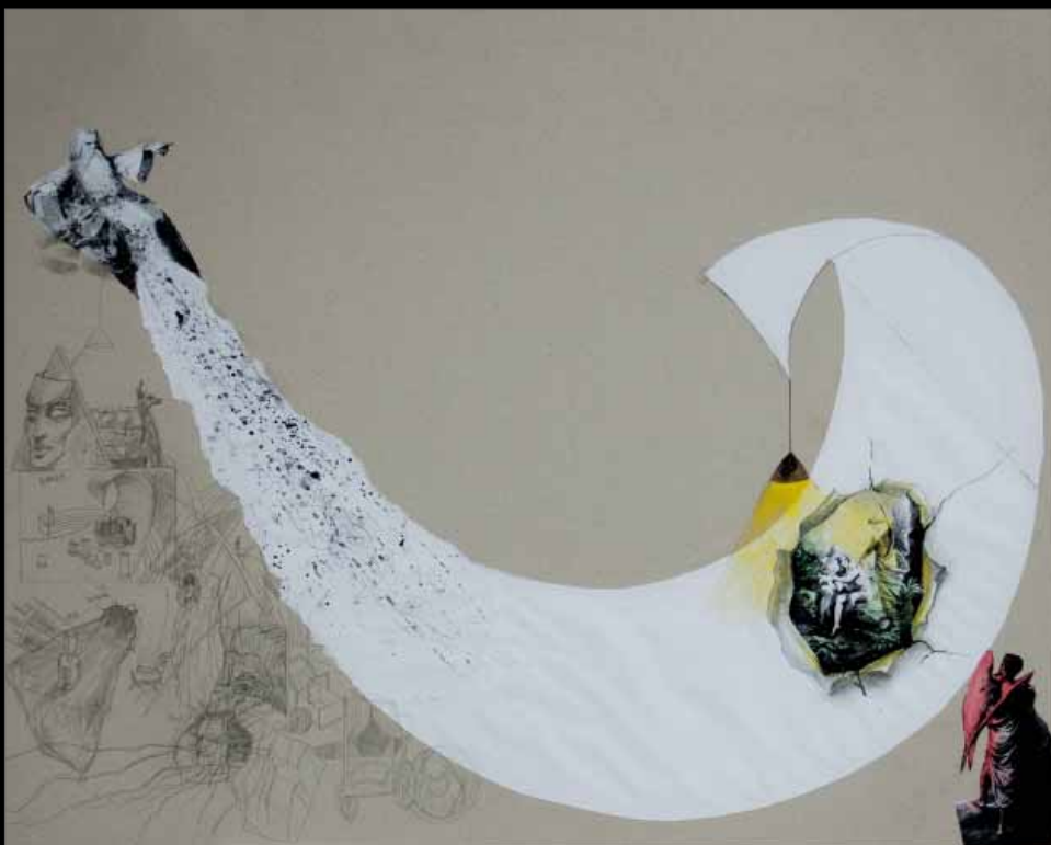
Díszletterv Madách Imre Az ember tragédiájához , Szegedi Szabadtéri Játékok (2011)