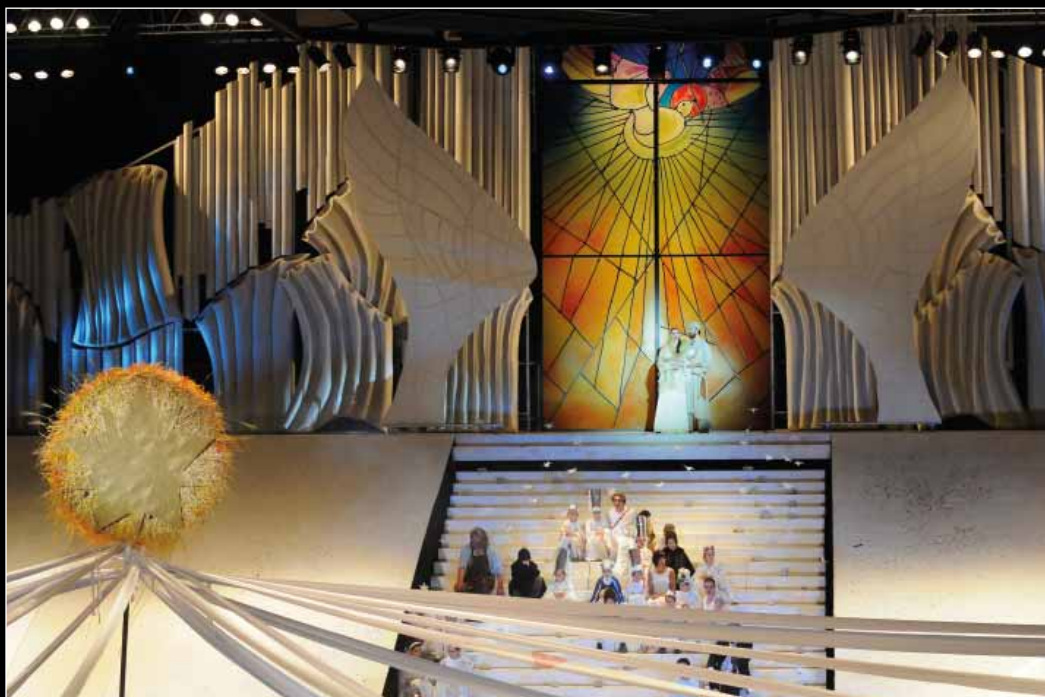
Szarka Tamás: Mária , Csokonai Színház (2011), r.: Vidnyánszky Attila, fotó: Máthé András