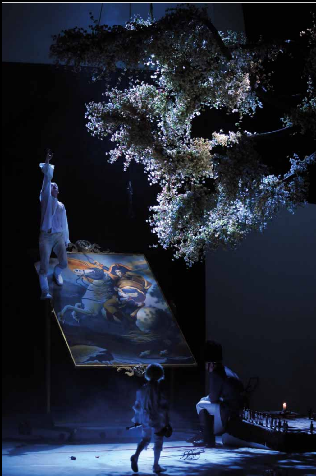
E. Rostand: Sasfűk , Csokonai Színház (2007), r.: Vidnyánszky Attila, fotó: Máthé András