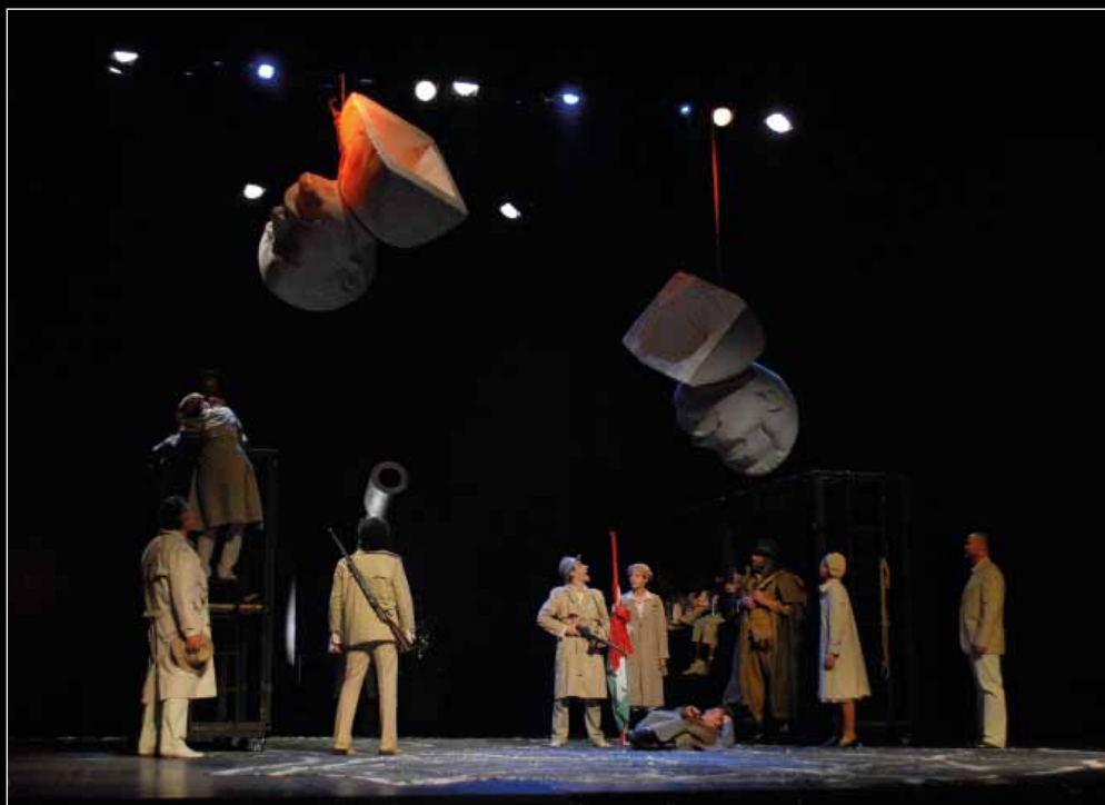
Szóts Géza: Liberté '56 , Csokonai Színház (2006), r.: Vidnyánszky Attila