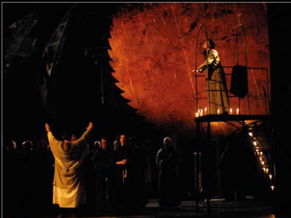
G. Verdi: A végzet hatalma , Csokonai Színház (2007), r.: Vidnyánszky Attila