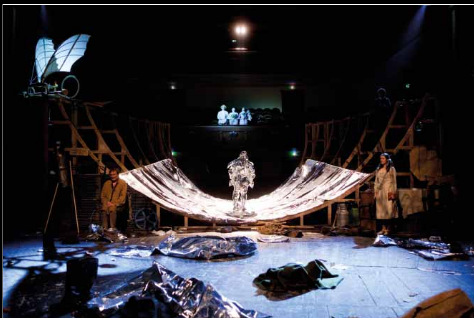
O. Zsukovszkij – Szénási M. – Lénárd Ö.: Mesés férfiak szárnyakkal , Csokonai Színház (2010), r.: Vidnyánszky Attila, fotó: Máthé Andrásfjodor Volkov Színház, Jaroslavl