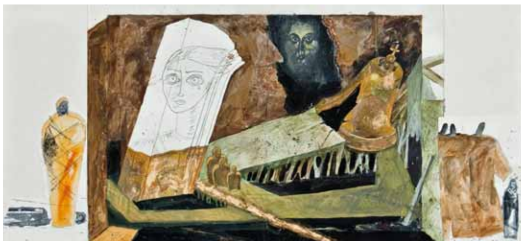
Borisz Godunov-díszletterv (2010)