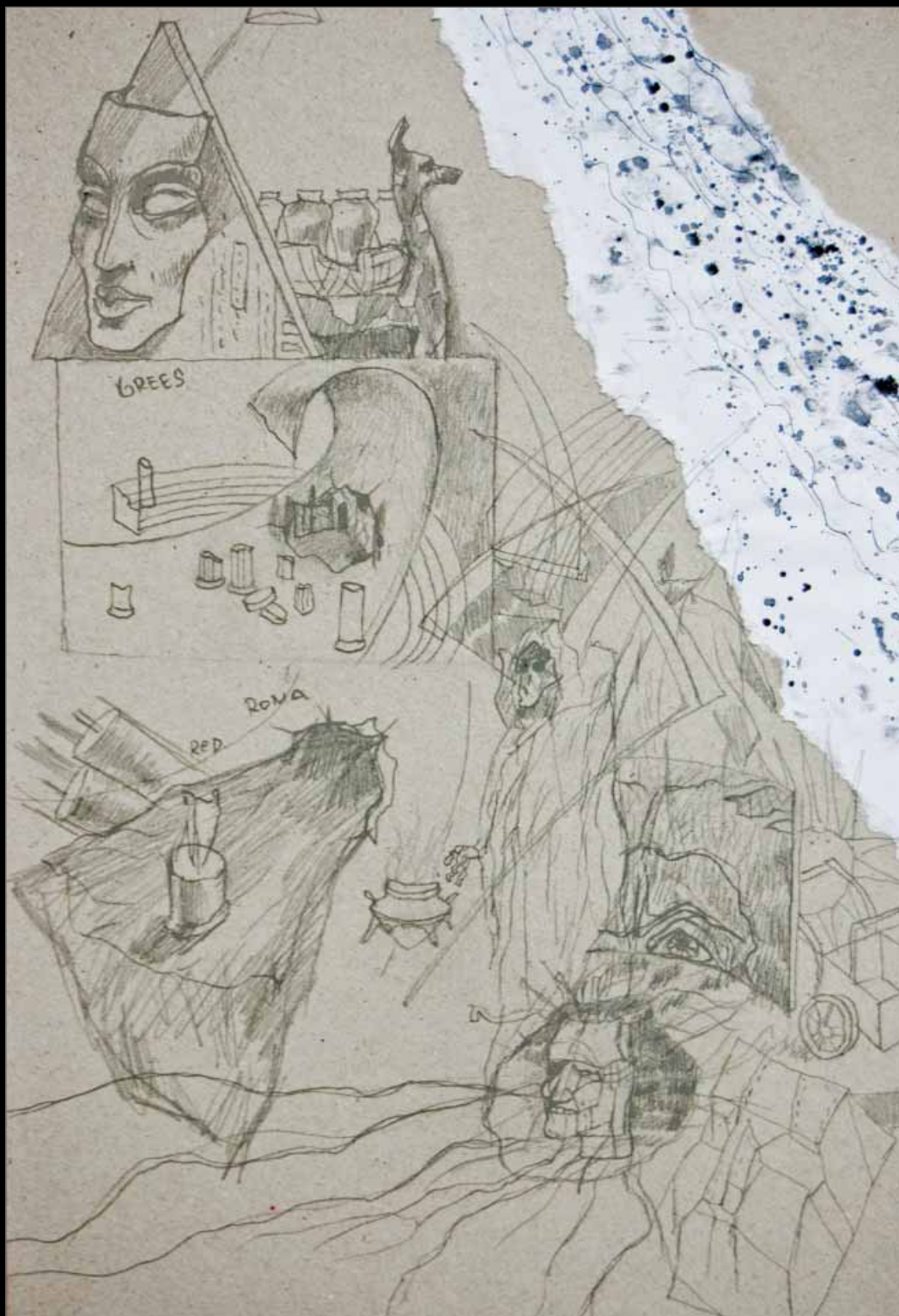
Díszletterv Madách Imre Az ember tragédiájához , Szegedi Szabadtéri Játékok (2011)