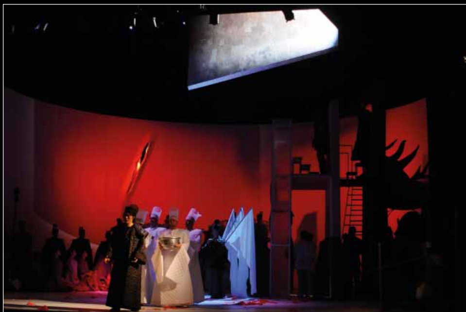
G. Puccini: Turandot , Csokonai Színház (2009), r.: Vidnyánszky Attila