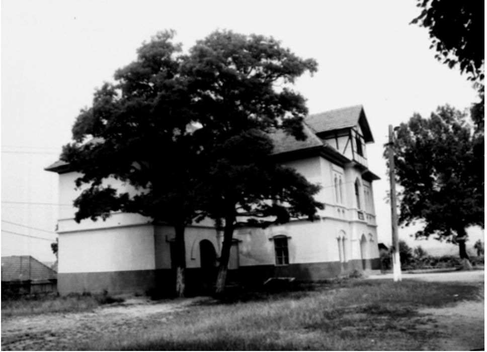
A koltói Teleki-kastély

gyok már (öthetes), maholnap talán már bölcső jön a házba s utána nemsokára koporsó. Egyebet sem teszünk, csak születünk és halunk.”