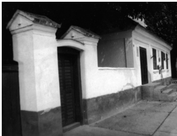
A volt jegyzői lak Sárszentlőrincen