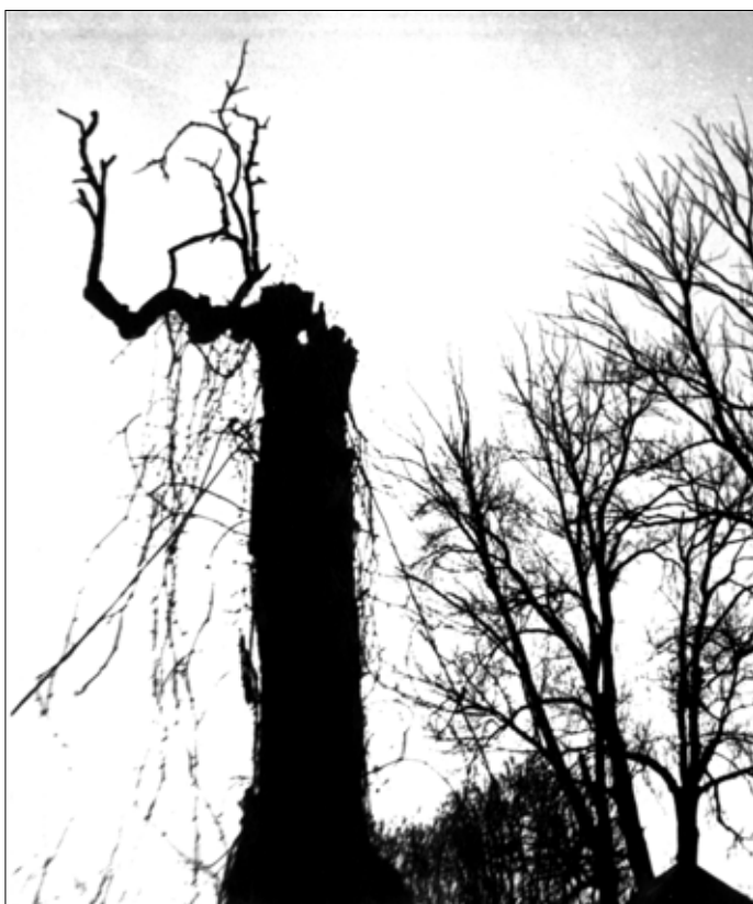
A keresztúri vén körtefa

„Július 31-én reggel 6 órakor indult el Petőfi az Újszékelyen volt főhadiszállására, de már ekkor a tábornok és táborigar útban volt Segesvár felé, hol akkor Lüdersz orosz tábornok állott 18 ezer emberrel és 48 ágyúval.” Petőfi ezúttal is Gyalókay kocsi-ján utazik. A fiatal tiszt vallomá-sában ismételtlen „a magyar nép kegyeletével való üzérkedésnek”