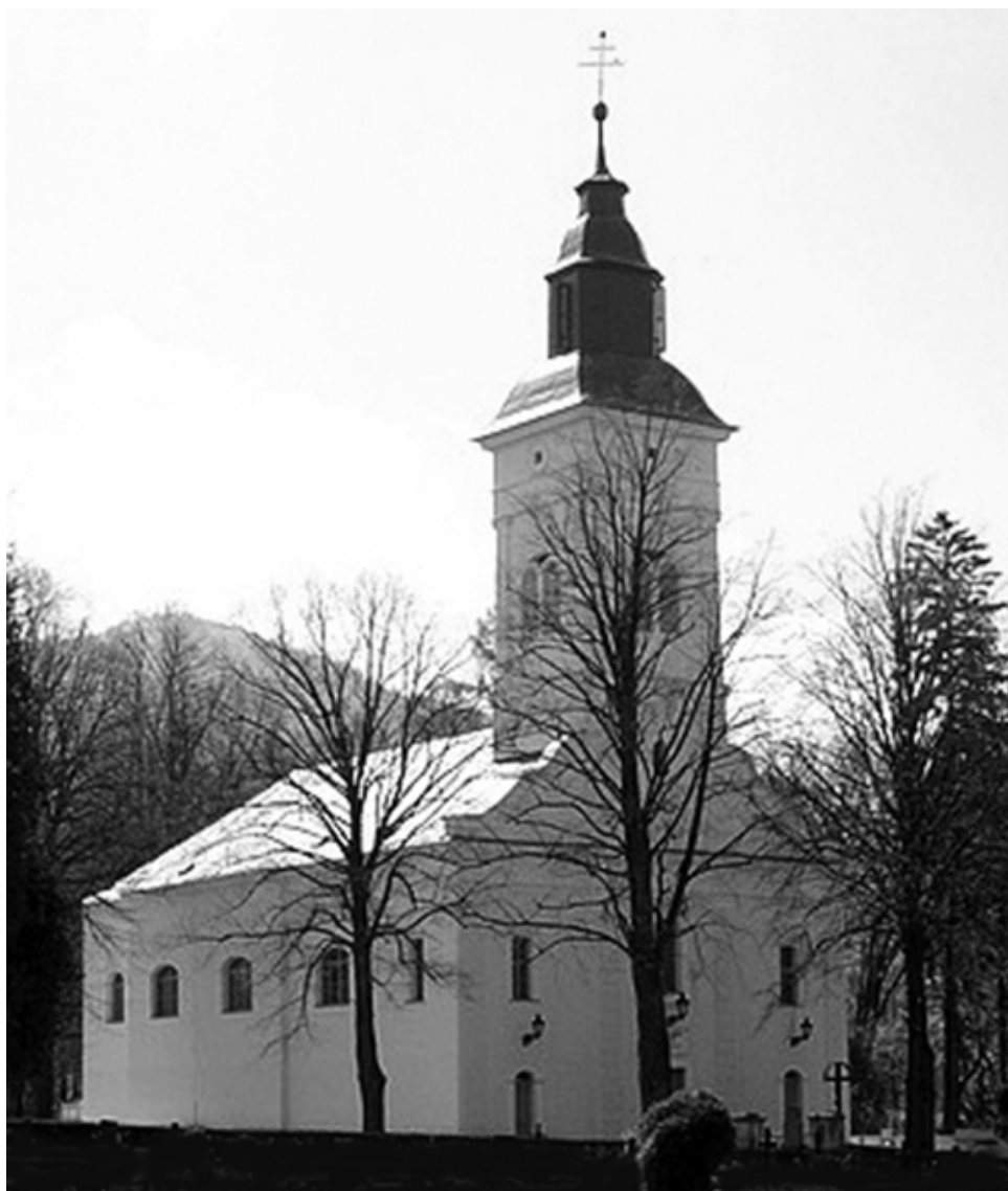
A necpáli katolikus templom. Túróc vármegye

ahol a gyermeket megkeresztelték, a zsoldárokat szlovákul éneklük. Többségében ezen a gyors hegyi patakok zúgó nyelvén adnak hírt az istenes asszonyok az újszülöttről...”