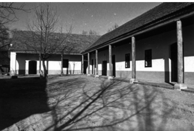
A szalkszentmártoni mészárszék és vendégfogadó ma