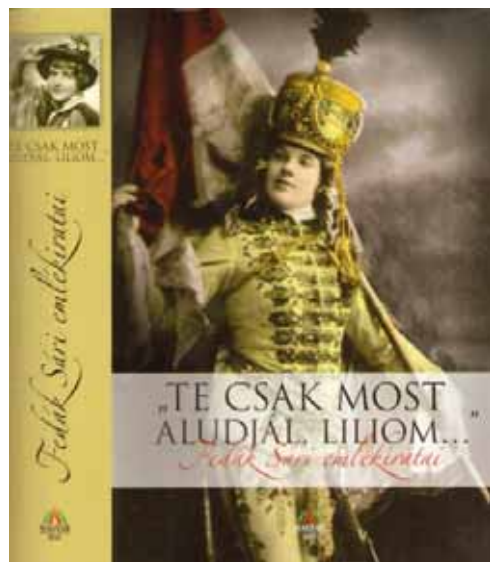
A könyvborítón Fedák Sári mint János vitéz