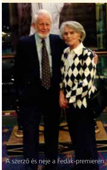
A szerző és neje a Fedák-premierén

„Fedák Sári (1879–1955) a 20. század első évtizedeinek legnagyobb hatású operettprimadonnája volt. Nem elsősorban szépségével, énektudásával, hanem mindenekelőtt kisugárzásával, a belőle mindig áradó életerővel hódított. Olyan írói nagyságok, mint Ady Endre vagy Németh László rajongtak érte. Igazi halhatatlanságának az is bizonyítéka, hogy neve fogalom lett az őt már nem látható későbbi generációk számára is. Hiszen például az utibban a „fedáksári” a legutolsó, a végső, a mindent felülmúló kontra neve. Fedák Sári egész életében vérbeli primadonnához méltóan állandó beszédtema volt, hol szerepei, hol magánélete okán. De nemcsak sikerekben és rajongó szeretetben volt része, hanem kudarcokban, ellene irányuló gyűlöletben és börtönbüntetésben is. Az 1945-ben berendezkedő új hatalom háborús bűnösnek nyilvánította. Alaptalan vádaskodások áldozata lett. Pedig csak két bűne volt, az őszintesége s a hazaszeretete.”