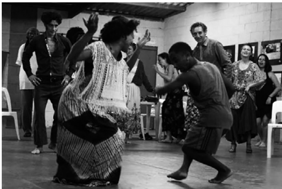
A 2016 júliusában Pontaderában tartott Szabad Ének műhelyt hirdető, a New York-i Grotowski Központban készült fotó

vivő egyének számára, hogy a dalokon és cselekvésen keresztül lehetőségük nyíljon az energia átváltoztatásának a megvalósítására. Emiatt van, hogy sokszor tanúk jelenléte nélkül játsszák el a darabot: „ Mikor a rituálé az istenség előtt történik, akkor rituálé, mikor pedig a nézők előtt, akkor színház. ”