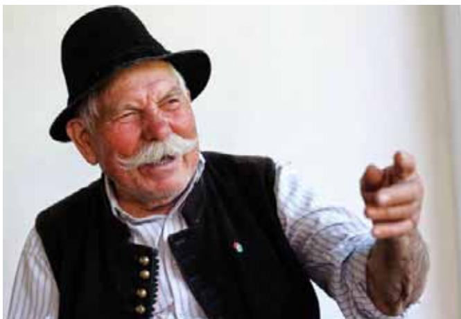
Pál István (1919–2015) dudás, énekes

A népdalok képesek arra, hogy megőrizzenek magukban bizonyos előadói technikákat. Amikor a doer előadja, azt érzi, kódolva van bennük egyfajta testiség, a mozgás, az éneklés, a járás, a tánc meghatározott módja... A népdalok ősi emlékeket rejtenek, melyek előadásuk során felfedezhetővé válnak. A hangregzés kvalitásainak köszönhetően képesek stimulálni, felszabadítani és aktiválni az energia-központokat.