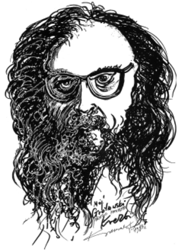
J. Grotowski (1933–1999) Zbigniew Kresowaty grafikája 1983-ból (forrás: wokimedia.org)

A Paraszínház időszakában a spontaneitásra összpontosított, valamint arra, hogy milyen kölcsönhatással lehet egymásra az emberi tevékenység és az embert körülvevő közösség vagy természeti valóság. A Források Színháza idején azt kereste, hogy mi az, ami képes felülmúlni az emberek közti különbségeket. Ennek érdekében létrehozott egy transzkulturális csoportot, és az emberi lény elemi összetevőit kezdte el vizsgálni, hogy feltárja, ami mindannyiunkat összeköt, s ami az emberi lét elválaszthatatlan velejárója. Ebben az időszakban sokat utazott csapatával, hogy a régi hagyományokkal, rituálékkal megismerkedve objektíven leírható mechanizmusokat és eszközöket tárjon fel. Marco de Marinis megfigyelése szerint ebben az új kutatási szakaszban a keresés magára az emberre összpontosult, viselkedésének különféle – testi és nem testi jellegű – technikáira, melyek „ lehetővé teszi, hogy az ember bárhol, bármilyen korban megőrizze eredeti gyökereit, saját organikus tevékenységének köszönhetően emelkedjen túl azokon a falakon is, melyek általában akadályozzák a benső és külső világra való nyitottságát, befogadóképességét. ” Ezek az eszközök később az Objektív Dráma korszak munkafolyamatának alapanyagaként szolgálnak. Kutatásai során sikerült olyan performatív alkotóelemekre bukkannia a rituálékban, melyek kulturális kontextusukon kívül is működőképesek lehetnek. Ez azonban a pontosság és precizitás követelménye folytán mesteremberi készségeket és művészi megközelítést igényelt.