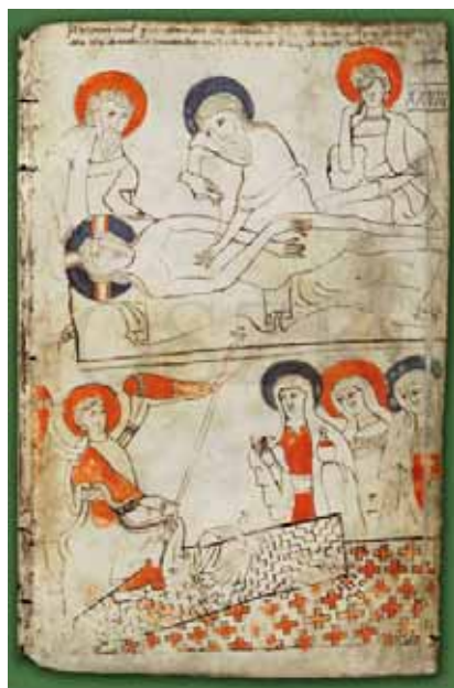
A sírbatétel és a feltámadás jelene a Pray-kódex 62. oldalán

Ès vimádjok szen[t] áhszin Máriát és bou dog Miháel árhángyelt és mënd ángyélkot, hugy vimádjanak éréttè! Ès vimádjok szent Pétër urat, kinek adot hatalm oudaniá és két-nië, hugy oudjá mënd ú bñnét! Ès vimádjok mënd szentököt, hugy légyenek neki segéd Uromk színe eleüt, hugy Isten iü vimádságok miá bulcsássá ú bñnét! Ès szobadohhá út ürdüing üdetüütül és pukul kínzatujátül, és vezessë út párádicsum nyugalmá belí, és adjon neki münyi uruszág belé utat és mënd jouben részét! Ès kiássátuk Uromkhuz hármúul: kyrie eleison!” – Itt bekapcsolódott a gyülekezet is. A megismételt felszólítás már jószerint azonos a latinnal. Kérjétek – teszi hozzá –, hogy az utolsó ítéletnél, a feltámadáskor – „íleszjë út! Ès tiü bennetük.”