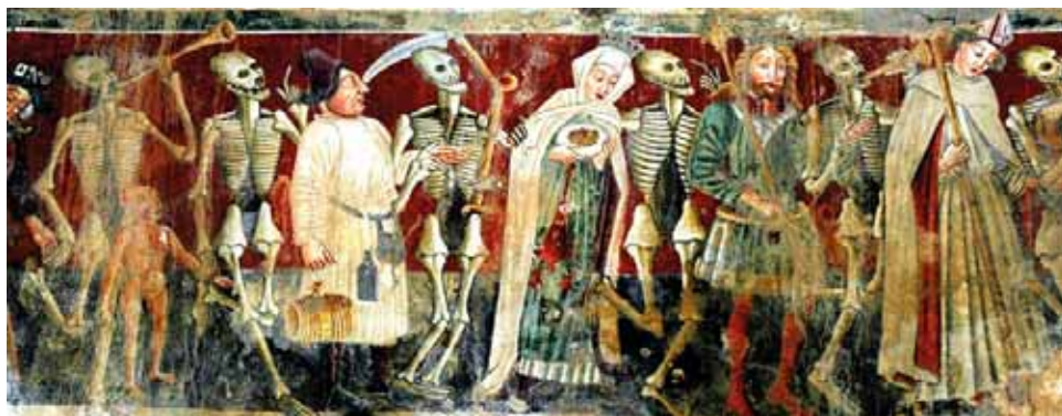
A Karmel hegyi Boldogasszonynak szentelt templomban látható Haláltánc részlete, freskó, Beram (Iztriai-félsziget), 1475

A kor másik divatos szimbolikus műformája a dance macabre , a haláltánc 20 – egy ilyen szövegünk is fennmaradt. Az egymás után táncba lépő maszkos, allegorikus figurák monológosorából íme, egy jellemző részlet: