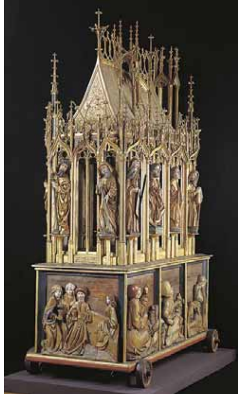
A Garamszentbenedeki úrkoporsó, 1480 körül, Keresztény Múzeum, Esztergom