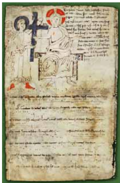
Énekszöveg és kottalejegyzés a Pray-kódex 63. oldalán