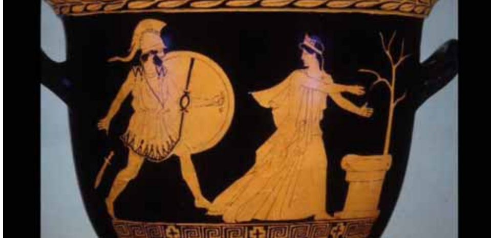
Meneláosz és Heléna attikai vörösalakos vázaképen, Művészeti Múzeum Toledo, Ohio

Hogy a ruha, a megjelenés, a külső üres vázzá válik, azt tarthatnánk akár szemléletbeli fordulatnak is a görög gondolkodásban. Hiszen a megjelenésre ebben a kultúrában mindig a hogylét üti rá pecsétjét. Az eidosz , a külső forma valamiképpen az ideával , a belső formával egylényegű, azt őrzi és tudatja. Nem is lehet másképp, hiszen maga az idea is képi lényeg, őskép. Látás és megértés mély, ősi kapcsolatát őrzi a két szó közös töve, a vid . A 'v' hangzó, a digamma az idők folyamán lekopott, de a latin nyelvben ismét megjelenik a video (=lát, megért) igében. Csakhogy miközben a görögök tisztában voltak vele, hogy a jelenség a lényeg tükré, azt is tudták, hogy a látszat gyakran csal. Hogy phüszisz és nomosz ellentétpárok. Hogy akit természete, phüszisze alkalmatlanná tesz egy feladatra, azt a nomosz , a rang még nem teszi arra méltóvá. Euripidész ezt mutatja föl a Helenében : a ködképpért küzdött, valódi feleségét előbb föl sem ismerő, rangkórságban szenvedő, nem uralomra termett király tragikomikus alakját, aki végül feleségével (aki nélkül még kitervelni sem tudná a szökést, mert annyi esze sincs) hajóra szállván az evezősöket (akik evezőlapáttal harcolnak a kardok ellen) nevetséges csatában (amely csata alig komolyabb az Aiasz-féle mézszárlásnál) legyőzi, és elhajózik, hogy soha meg nem érdemelt trónját elfoglalja.