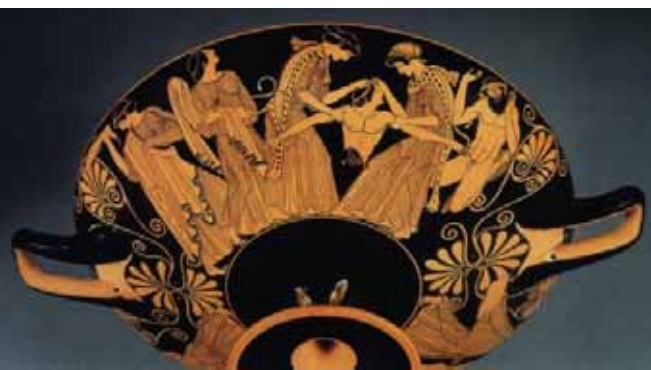
A Pentheuszt széttépő bakkhánsnők athéni vörösalakos vázaképen i. e. 480-ból, Kimball Art Múzeum, Texas

Mások épp ellenkezőleg értelmezik a dolgot. Az ő véleményük szerint Euripi-