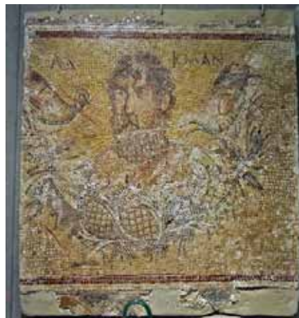
Alkman mozaikportréja Jordániából, Jerasból, az i. sz. 2–3. századból

az istenvilág megbocsátott neki, és visszaadta látását. A bocsánatkérő költemény szerint Parisz sosem vitte magával Helenét Trójába, csak a nő árnyképét, élethű másolatát. Az igazi Helené Egyiptomba ment, Próteusz királyhoz, aki később Meneláosznak visszaadta őt. (Euripidész drámájában Próteusz már halott, amikor Meneláosz partot ér Egyiptomban.) A trójai háborút kiváltó szőke démon tehát csak egy ál-Helené volt, dublőr. Euripidész fölvette ennek a mesének a fonalát, holott célja egészen más volt, mint annak idején Sztészikhorsznak. Ő elődje apologetikus történetét is arra használja, hogy hagyományromboló módon kifejtse véleményét a görögök egy emblematisz alapemlékéről, a trójai háborúról, és ezzel szoros összefüggésben Menelaósról, valamint a hadviselés értelméről általában.