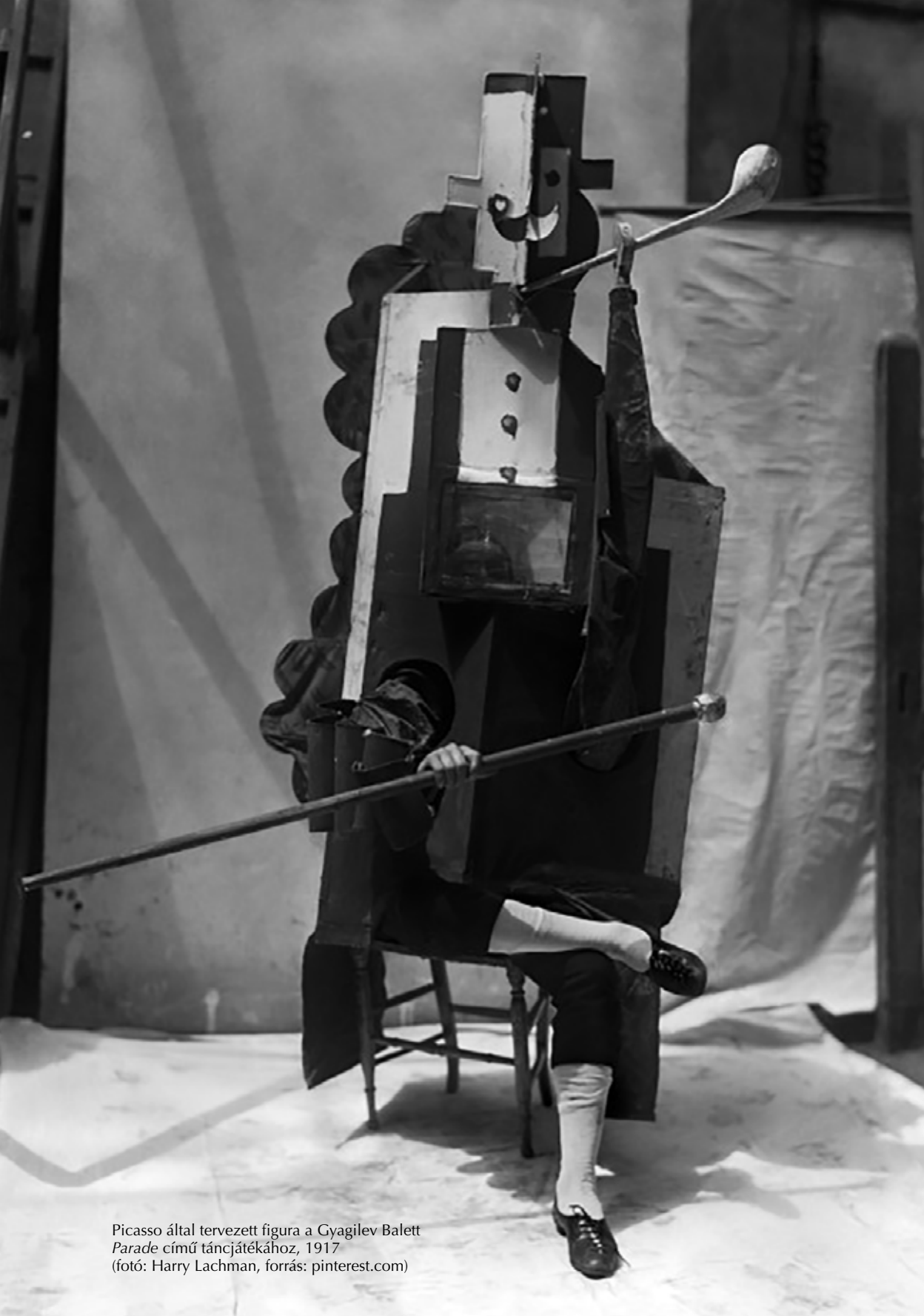
Picasso által tervezett figura a Gyagilev Balett Parade című táncjátékához, 1917