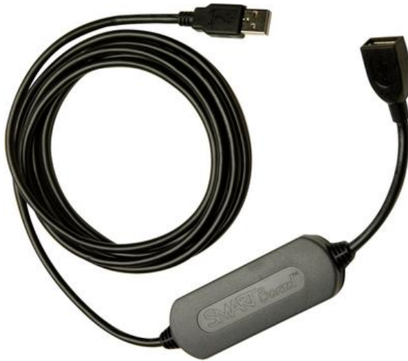
7. kép A SMART GoWire kábel