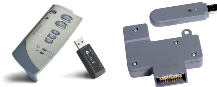
8. kép A vezeték nélküli mimio interaktív tábla és a SMART táblák vezeték nélküli kiegészítője