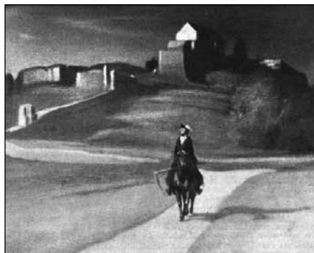
11. ábra: Kacziány Ödön: A vándorló halál (1911)