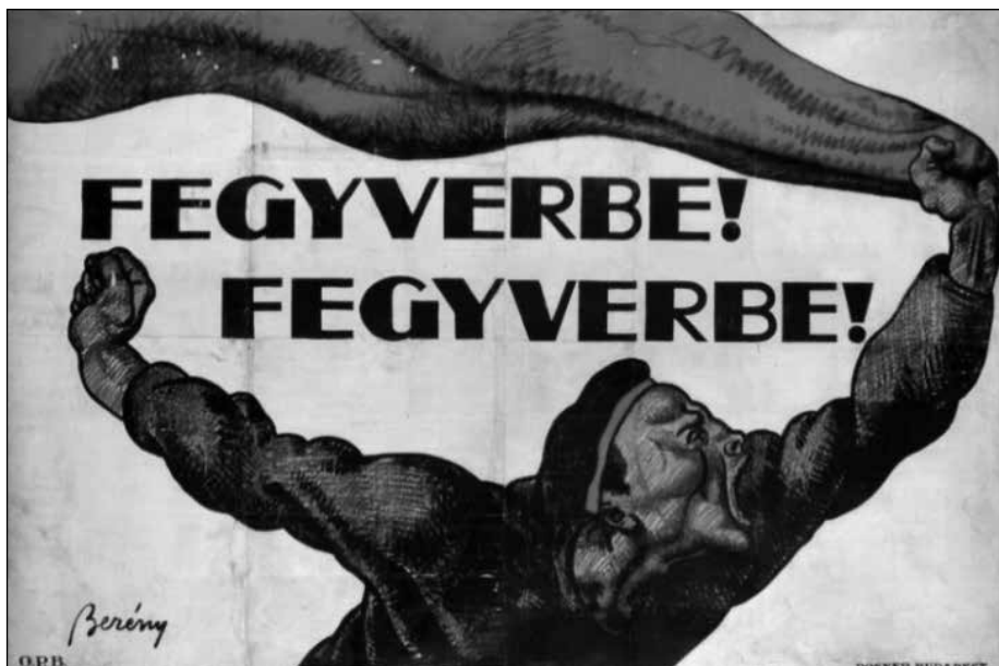
14. ábra: Berény Róbert: Fegyverbe! Fegyverbe! (1919)