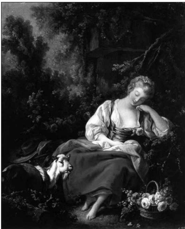
9. ábra: François Boucher: La Jardinière endormie (1762)

Ezt a narrációs stratégiát, a vizuális és verbális kifejezőmód érintkezését alkalmazva kerül beépítésre A költő és a halál írásába a költő előtt megjelenő Halál perszifikációja is, ki kinézetében szintén képzőművészeti alkotásokon, pontosabban Kacziány Ödön egytónusú kompozícióin (10–13. ábra) látottak alapján elevenedik meg. Kacziányról Ninkov Kovačev Olga jegyzi a tényt, hogy egész életművében, leszámítva életképeit, leginkább a halál kötötte le a figyelmét. Képeit a vad, világvégét jósoló színek, a gomolygó felhők és a kietlen tájak jellemzik, kedvenc alakjaként pedig a századforduló emblematikájának egyik fő elemének számító kaszás halál tűnik fel (Ninkov Kovačev, 2010: 61). A képzőművész említett képein a Halált megtestesítő figura egymaga, többnyire lovon ülve és sötét lepelbe burkolózva, a kezében hatalmas kaszával szerepel. Az arcvonásai elmosódtak és kivehetetlenek, annak titokzatosságát és fenyegető jellegét tovább növelve. Milkó Kacziány Halál-ábrázolásnak megfelelően idézi meg ekphrasztikusan a saját fikciós alakját. A drámai hatás fokozása érdekében, mely ugyanakkor a reprodukció hiánya miatt a festmény helyettesítését is szolgálja, a jelzett szövegrészben a következő, vizualitást pótló ismertetőt közli: „De amint látja, ide elegáns módon állítottam be. Közöséges nyárspolgároknál és egyéb