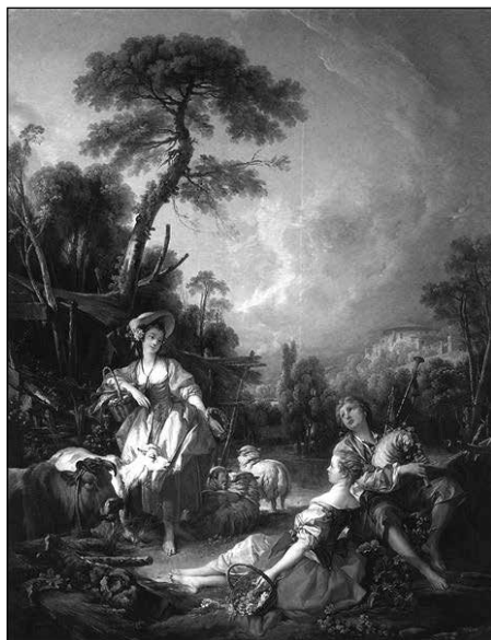
7. ábra: François Boucher: Un été pastoral avec un joueur de cornemuse (1749)