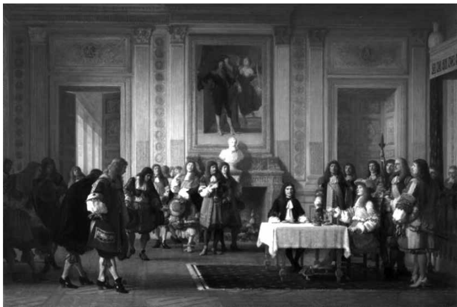
4. ábra: Jean Hégésippe Vetter: Molière reçu par Louis XIV (1864)

zott tárgyat a befogadóban. Viszont más alkalmakkor Milkó az olvasó ismeretében bízva mindössze utal bizonyos, intertextuálisan megnyíló művekre, ahogy teszi az Eveline választban , melyben Raffaello Sanzio Madonna della Seggiola festménye (1513–1514) (5. ábra) idéződik meg pár pillanat erejéig. Hozzá kell tenni, hogy ezen alkotáshoz nem járul kiemelt rendeltetés, a szövegtér vizuális kellékeként tűnik fel azon epizódban, amikor a novella hősnője, Eveline a „Vallást s egyben a Művészetet” képviselő festmény másolata előtt imádkozik, és kér segítséget, hogy választani tudjon két kéréje között (Milkó, 1924b: 51). Emiatt a történet szempontjából elegendőnek bizonyul a befogadónak nyújtott röpké utalás is, amely inkább a szöveg jelentésstruktúrájának kialakításában játszik szerepet abban a tekintetben, hogy a reneszánsz alapokon nyugvó szentképek ábrázolási szokásait, illetve a hozzájuk fűződő vallási áhítatot idézi meg.