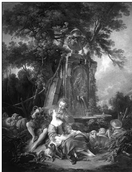
6. ábra: François Boucher: Un automne pastoral (1749)

A fentiekben is tapasztaltak esetében a fikción kívül létező, szóba hozott festmények nem figyelhetőek meg közvetlenül, hanem kizárólag csak az emléképeket előhívó belső látás számára válnak hozzáférhetővé (Orosz, 2003: 158). A Forradalom előtt ben idézett, képi hivatkozás értelmezéséhez szintén ismernünk kell François Boucher alkotásait ahhoz, hogy az elbeszélés alakját vizuálisan a képen látható alakokkal tudjuk azonosítani, hiszen e nélkül az utalás nem éri el tervezett célját. Boucher életművéből jól kitűnik, hogy kedvelt témájaként, egy egész sorozatnyi, idealisztikus jeleneteket ábrázoló olajfestményén pásztorlány alakokat festett meg (6–9. ábra).