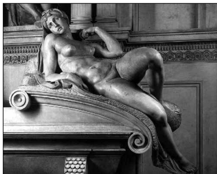
2. ábra: Michelangelo: Medici-sírelék Hajnal (1520–1534)

rancsoló mint Dianáé, s arcának elefántcsontszínű fehérségéből csodásan világítottak ki mélytüzű fekete szeméi, melyeknek pillantására verssé lett minden próza és szonetté minden ostobaság. Tiraboschi 4 pedig azt jegyzi fel róla, hogy majdnem földig érő haja oly dús volt, miképp beburkolózhatnék s eltakarhatta vele minden bájait egészen a lábújja hegyéig. Burlamacchi 5 végül formás kis kezeiről és keskeny finomnyergű lábairól ad hírt az ámuló utókornak, mely ez adatok alapján legalább halavány képet alkothat magának egy a renaissance korszakában virult szépséges szűz plasztikus erényeiről” (Milkó, 1924a: 9–10).