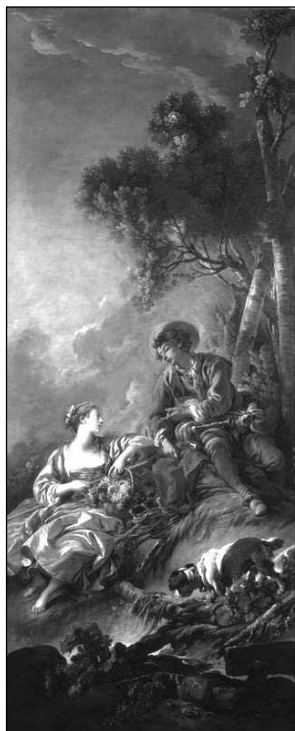
8. ábra: François Boucher: L'Aimable Pastorale (1762)