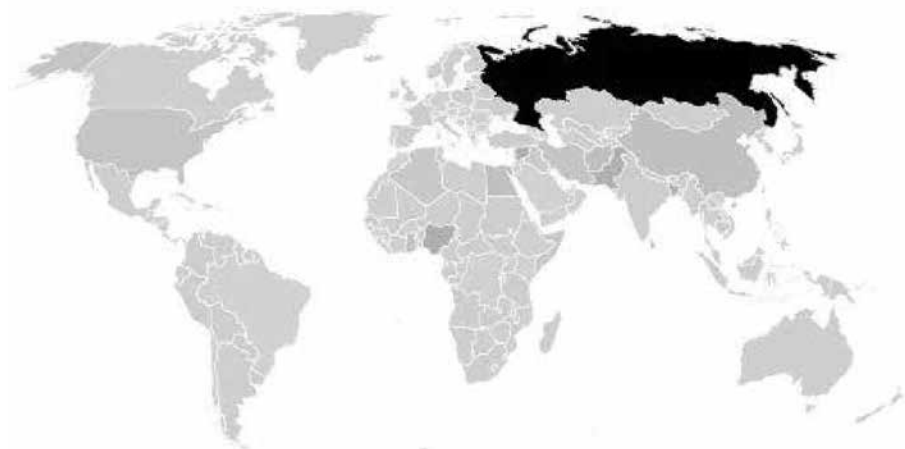
Графички приказ 1.

Политичка и административна ограничења која су на снази у првонаведеним земљама узроци су због којих и Центар, узимајући у обзир актуелне законске регулативне на националном и европском нивоу, није у могућности да на прави начин одговори молбе и захтеве заинтересованих странаца и омогући њихов долазак на курсеве српског као страног језика. Пракса нам такође показује да управо странци из наведених земаља као прилоге шаљу копије својих сведочанстава о завршеној школи и пасоша, настојећи да конкретним доказима убеду управу Центра у своју заинтересованост. Њихови, врло често привидни, подстицаји су могућност студирања у Републици Србији, љубав према језицима, односно заљубљеност у српску културу, традиционалну храну и музику. Нажалост, искуство нам говори да је, у већини случајева, реч о покушају проналаска сигурног и безбедног окружења за живот сопствене породице.