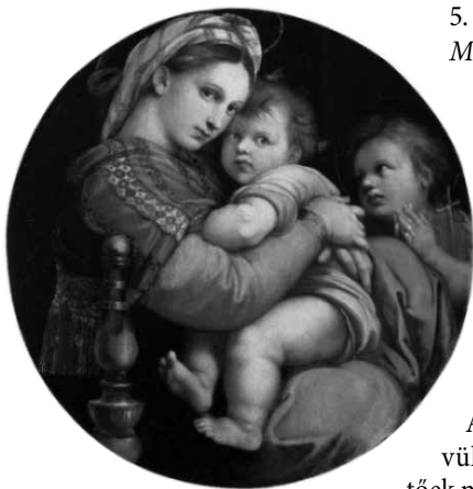
5. ábra: Raffaello Sanzio: Madonna della Seggiola (1513–1514)