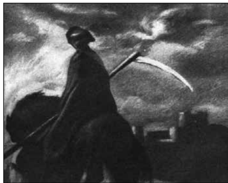
10. ábra: Kacziány Ödön: Mors eques (1900–1903 között)

szürke halandóknál gyalokszerrel szoktam megjelenni a kaszámat suhogtatva, – önt, poétát, megbecsültem azzal, hogy lovon nyargaltam be, ahogy egyszer Kacziány megfestett, s a kaszámat eldugtam a köpönyegem alá” (Milkó, 1924c: 16).