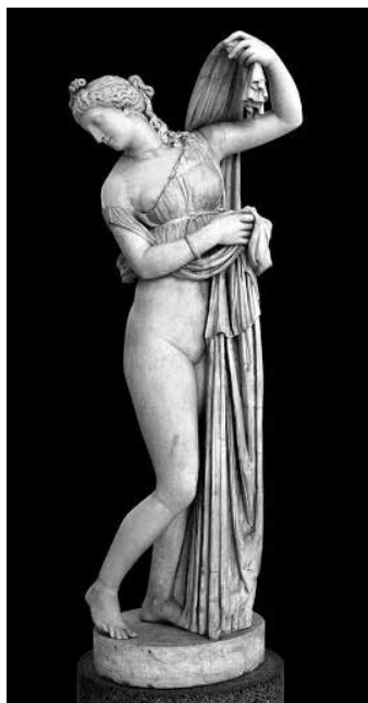
3. ábra: Anonymus: Venus Callipyge

„Őket akarom megszégyeníteni, az istennőket... Itt vannak Tizian déessei-ei s a Canova Venus Victrix-e, a kit fűtött szobában mintázott a művész a legszebb Bonaparte-lány fehérségeiről. Aztán egy sereg antik Vénusz: a Louvre-beli milói hölgy, a ki – szegény! – nem viselhet karpereczeket, a medicei, a kapitóliumi, meg a nápolyi Kallipigosz, a kinek a nevét csak görögül szabad kimondani, a capuai, és még egy pár, a melyek mind csúfak magához képest...” (Milkó, 1897: 79).