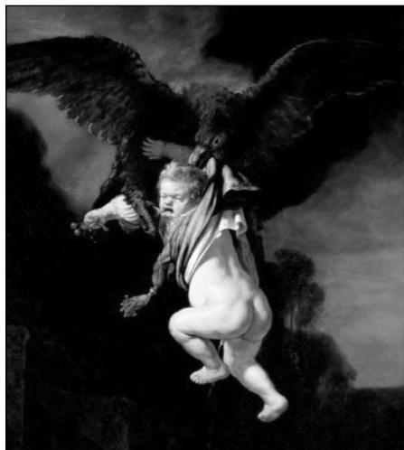
15. ábra: Rembrandt: Ganymed in den Fängen des Adlers (1635)

Az irodalmi művek vizuális intertextusainak azonosítása azonban nem mindig bizonyul egyszerű feladatnak. Csáth a Palincsay novellájában röviden megemlíti négy, a narrátor által „érdekes és gondolkodásra keltőnek” titulált képet: a Ganümedész elrablását , a Téli szánkázást , a Szarvasvadászatot és a Velencei éjt (Csáth, 1994: 393–394). Ám azokat a képleírások híján nem lehet egyértelműen létező festményekhez kötni, meg lehet, hogy nincs is valós megfelelőjük. Így az sem állítható biztosan, hogy a Ganümedész elrablása