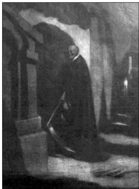
12. ábra: Kacziány Ödön: Pallida Mors (1906)

A fenti novellákból látszik, hogy Milkó fikción kívül létező képi utalásait hol illusztratív, hol helyzetteremtő formában vonja bele műveibe, amelyek számbavételét követően az is kitűnik, hogy a szöveg médiumában működő, szó és kép érintkezések hatásfoka a szükséges ismeretek vagy leírás hiányában csakis alacsony szinten mozoghat.