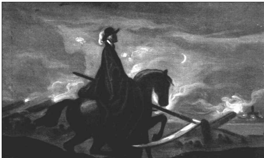
13. ábra: Kacziány Ödön: A háború aratója a Dardanelláknál (1917)