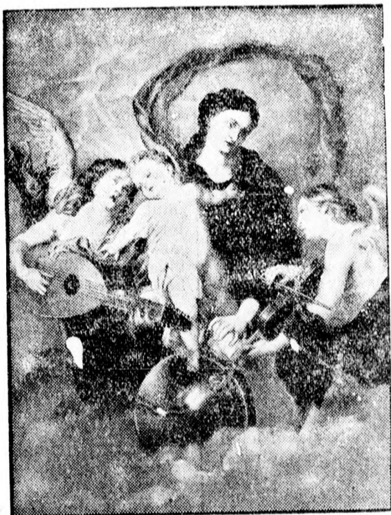
Az ellopott kép.