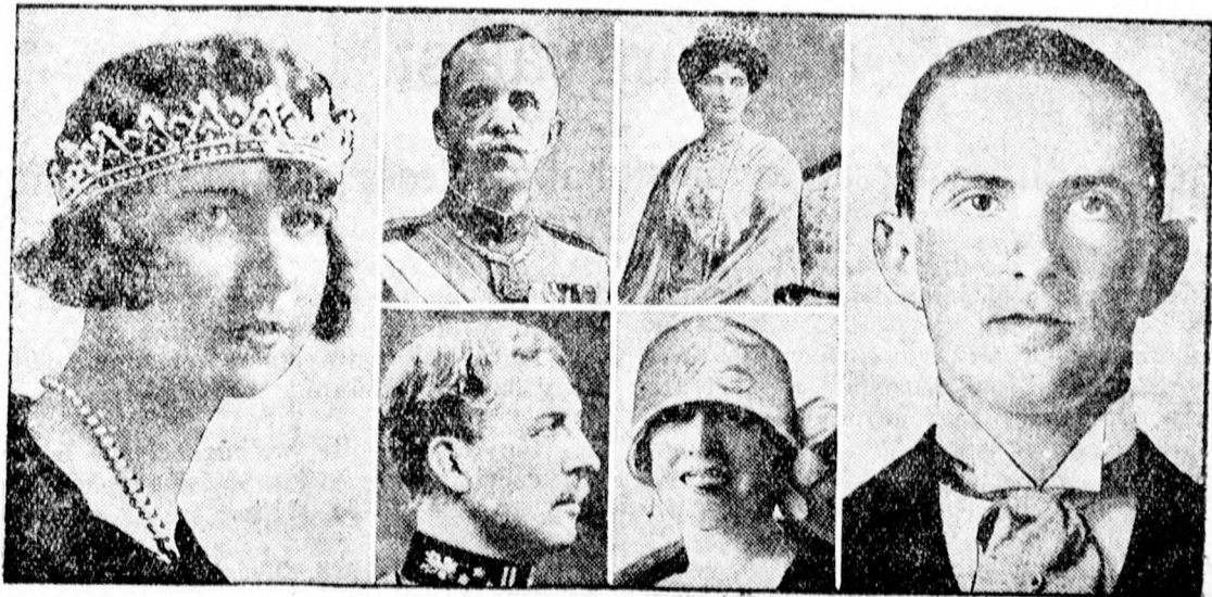
Mária José belga királyi hercegnő a menyasszony